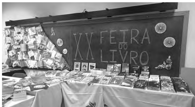
FEIRA DECORRE ATÉ 12 DE DEZEMBRO

A sessão contou com a presença da diretora do agrupamento, professores, assistentes operacionais, alunos, ex-alunos e encarregados de educação, que se juntaram para celebrar a iniciativa. O espetáculo de abertura integrou várias apresentações preparadas pelos alunos, incluindo momentos de canto, dança, teatro, dramatizações e performances musicais, evidenciando o envolvimento dos estudantes e o trabalho colaborativo das equipas