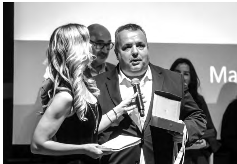
SANTO TIRSO FOI, ESTE ANO, O ÚNICO MUNICÍPIO A RECEBER ESTA DISTINÇÃO

Santo Tirso tem vindo a ser distinguido com a Marca Entidade Empregadora Inclusiva desde 2019, distinção atribuída bi-anualmente. Esta é já a quarta vez que o município vê reconhecidas as suas boas práticas de inclusão laboral, sendo, no entanto, a primeira vez que alcança a Menção