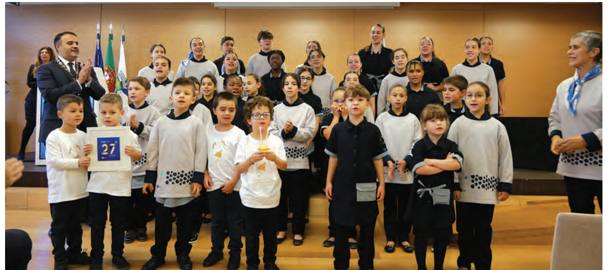
MENINOS CANTORES DO MUNICÍPIO DA TROFA ABRILHANTARAM SESSÃO SOLENE

em que as duas maiores juntas de freguesia, Bougado e Coronado, vivem momentos de incerteza política, ainda sem executivos de Junta aprovados.