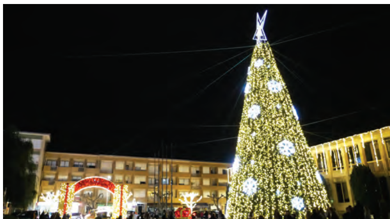
CORACÃO DAS FESTIVIDADES VOLTA A SER A PRAÇA 25 DE ABRIL

A agenda cultural complementa o ambiente festivo. O Centro Cultural Municipal de Vila das Aves recebe, até 31 de dezembro, o Bazar & Mostra – Produções Artesanais, bem como a exposição “Vamos conhecer o Natal: simbologia, tradições e curiosidades”, patente de 10 de dezembro a 17 de janeiro, com entrada livre. A Biblioteca Municipal e o próprio Centro Cultural dinamizam oficinas, cinema e horas do conto durante todo o mês, enquanto o Museu Internacional da Escultura Contemporânea acolhe, a 8 de dezembro, às 18h00, um concerto do Quarteto Suggia, com obras de Beethoven, Borodin e Morricone.