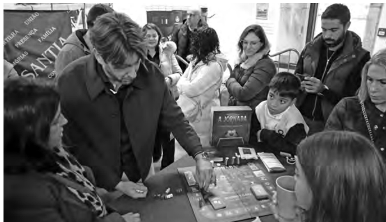
JOGO TEM O FUTEBOL COMO TEMA CENTRAL

“A Jornada” é o primeiro passo desse propósito. O jogo, direcionado para famílias e grupos de amigos, tem o futebol como tema central. Segundo o criador,