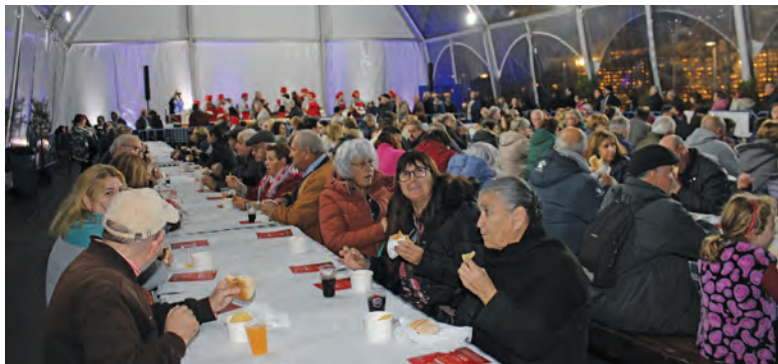
TRADICIONAL VITELA JUNTOU CENTENAS DE PESSOAS

As freguesias, em particular, foram destacadas como a primeira linha de contacto com a população. “Num tempo em que as diferenças políticas às vezes gritam mais alto do que deviam, as freguesias provam que é possível cooperar com responsabilidade”, afirmou, num momento