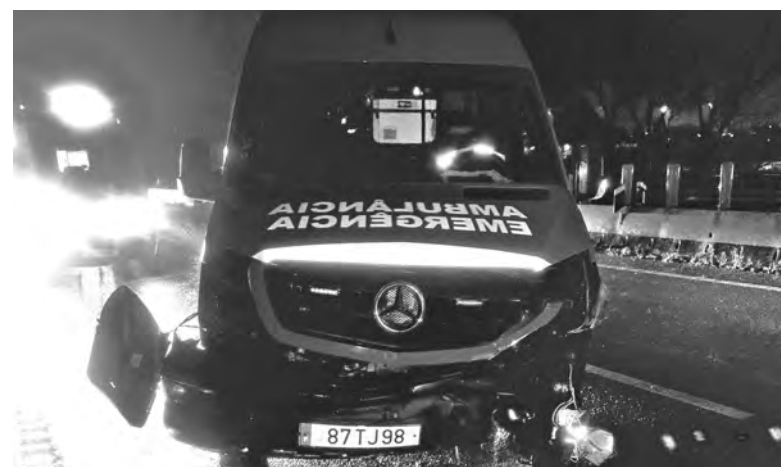
TRÊS OCUPANTES DA AMBULÂNCIA SOFRERAM FERIMENTOS LIGEIROS

Os ocupantes foram prontamente assistidos por outros elementos dos Bombeiros da Trofa, que regressavam do Hospital