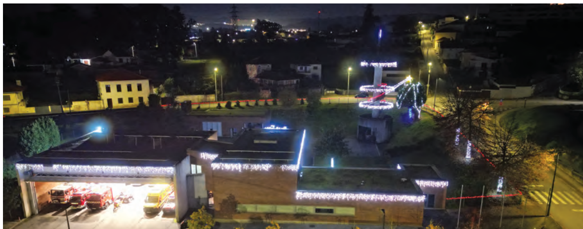
BOMBEIROS ACENDERAM ILUMINAÇÃO DE NATAL ÀS 19 HORAS DO DIA 30 DE NOVEMBRO

Apesar da alteração, o dia 30 de novembro continuou especial no quartel. Pelas 19h00, os Bombeiros Voluntários de Santo Tirso acenderam oficialmente as iluminações de Natal, numa celebração que quiseram partilhar com toda a comunidade.