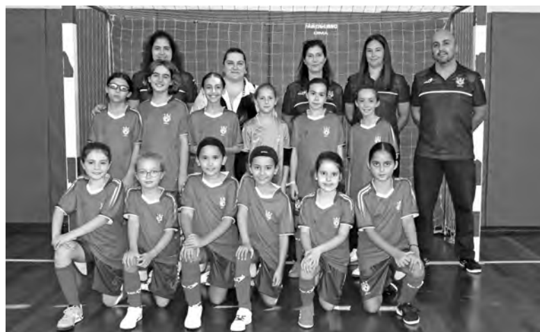
EQUIPA FOI CRIADA ESTA ÉPOCA

Para o GCR Alvarelhos, esta estreia tem um significado profundo. Em comunicado, a coletividade sublinha que “a realização do campeonato de futsal feminino Sub-11 marca um passo decisivo para o crescimento da modalidade, criando oportuni-