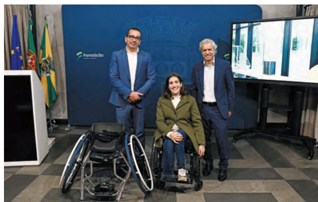
APOIO DE CINCO MIL EUROS MELHORA CONDIÇÕES DA ATLETA modalidade" com um impacto decisivo na sua evolução.

A única mulher em Portugal a competir em ténis em cadeira de rodas sublinhou que este novo equipamento representa um salto significativo na preparação e no rendimento. "É um equipamento fundamental para competir ao mais alto nível e para conseguir dar o salto que tenho vindo a trabalhar", afirmou, destacando que o apoio lhe permitirá concentrar-se totalmente "no treino, na progressão e nos resultados". A atleta descreveu ainda a nova cadeira como sendo feita à sua medida, "mais ágil e mais leve", um "modelo topo de gama da