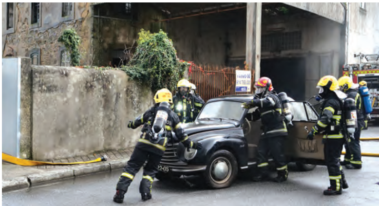
LOCAL SERVIA DE GARAGEM

TRÊS OCUPANTES DA AMBULÂNCIA SOFRERAM FERIMENTOS LIGEIROS