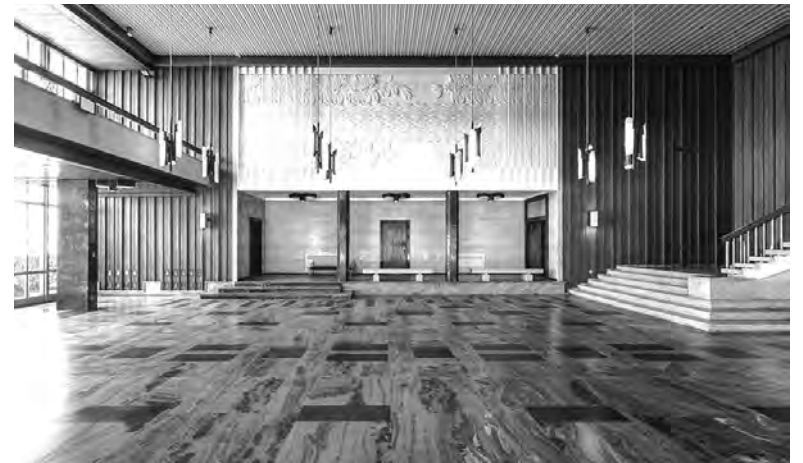
AUTARQUIA CONTINUA A PRIVILIGIAR O INVESTIMENTO PÚBLICO

O Município destaca que 2026 será um ano exigente, devido à execução de “verbas provenientes de fundos comunitários”, que sobem para 18,9 milhões de euros, mais 23% do que em 2025. Estes montantes destinam-se a apoiar várias obras e projetos incluídos no Plano Plurianual