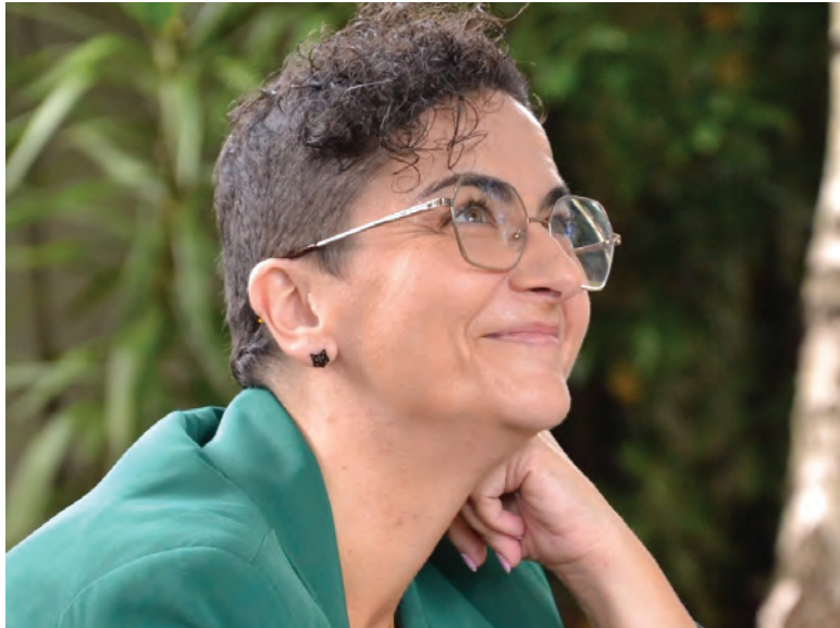
APRESENTAÇÃO ESTÁ MARCADA PARA 6 DE DEZEMBRO