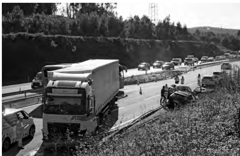
ACIDENTE OCORREU AO QUILOMETRO 12,1 DA A3

Um acidente ocorrido ao início da manhã de 26 de novembro, no quilómetro 12,1 da A3, na União de Freguesias de Coronado (S. Romão e S. Mamede), exigiu uma operação de socorro