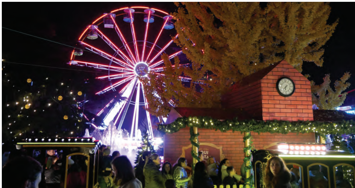
ANIMAÇÃO ARRANCOU A 28 DE NOVEMBRO