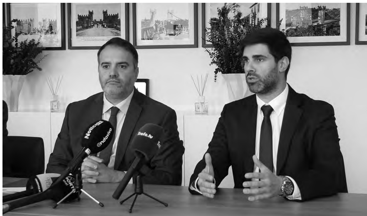
PRESIDENTE AFIRMOU QUE O OBJETIVO DAS NEGOCIAÇÕES SEMPRE FOI GARANTIR “ESTABILIDADE GOVERNATIVA”

No fim da reunião de Câmara de 27 de novembro, em declarações aos jornalistas, os vereadores do movimento independente TDT afirmaram que antes do