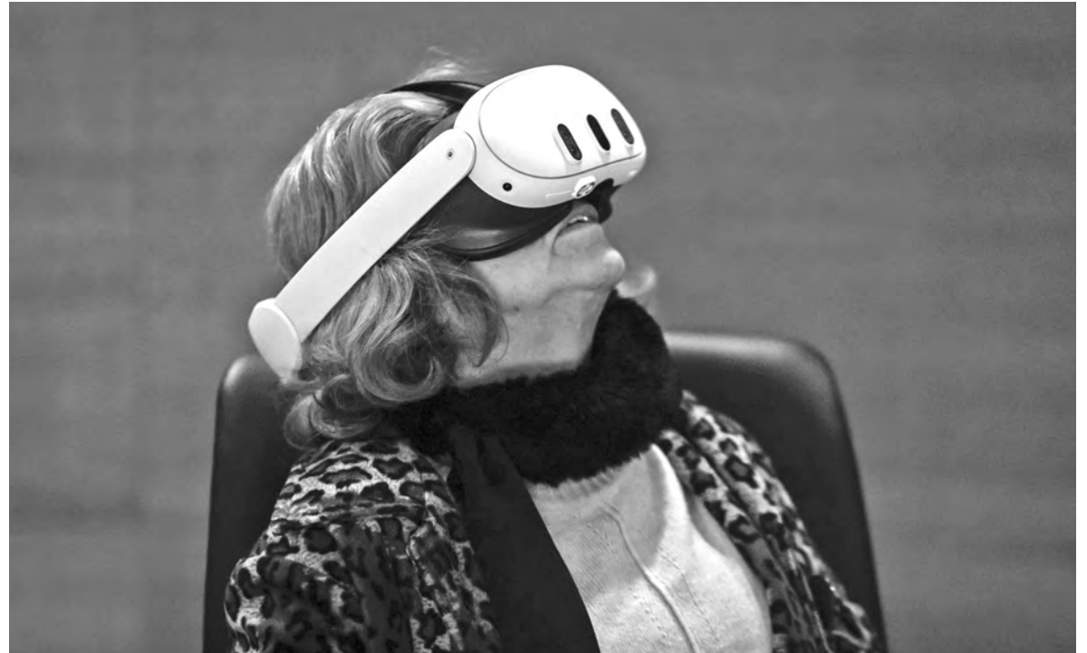
“MEMÓRIAS QUE ATRAVESSAM O TEMPO”, RECORREU À REALIDADE VIRTUAL PARA TRABALHAR RECORDAÇÕES

Promovido em parceria com o Laboratório de Reabilitação Psicossocial da Escola Superior