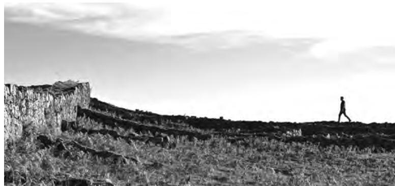
EXPOSIÇÃO COM PEÇAS CONCEBIDAS ATRAVÉS DE IMERSÕES FEITAS PELO PAÍS

A inauguração de “Traslados” está marcada para as 19h00 de 5 de dezembro. O Museu Internacional de Escultura Contemporânea mantém o horário habitual: de terça a sexta-feira, entre as 09h00 e as 17h30, e aos fins de semana das 14h00 às 19h00. A entrada é gratuita.