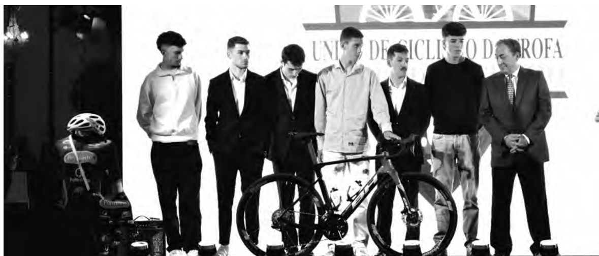
CLUBE APRESENTOU EQUIPA PARA A PRÓXIMA CAMPANHA DESPORTIVA

A gala contou também com a presença do presidente da Câmara Municipal da Trofa, Sér-