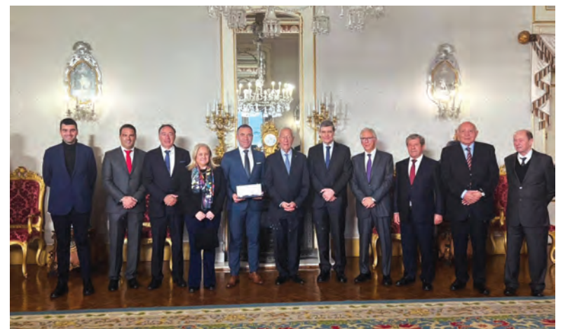
AEBA É MEMBRO HONORÁRIO DA ORDEM DO INFANTE D. HENRIQUE

Na nota divulgada, a AEBA agradece ao Presidente da República pela honrosa distinção e expressa também gratidão às empresas, parceiros, associados e a toda a comunidade que dia-