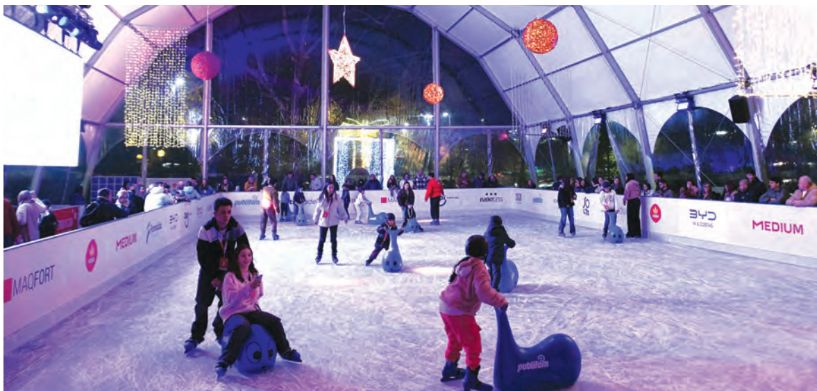
PISTA DE GELO REGRESSA PARA ANIMAR MIÚDOS E GRAUÇOS

Toda a informação está disponível em famalicao.pt, permitindo a todos planear a visita e aproveitar ao máximo esta quadra festiva.