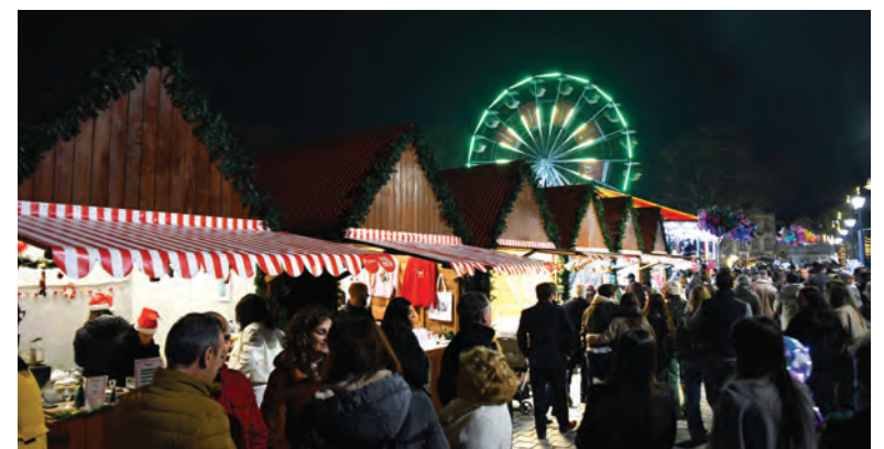
CIDADE ILUMINA-SE COM QUATRO MILHÕES DE LUZES