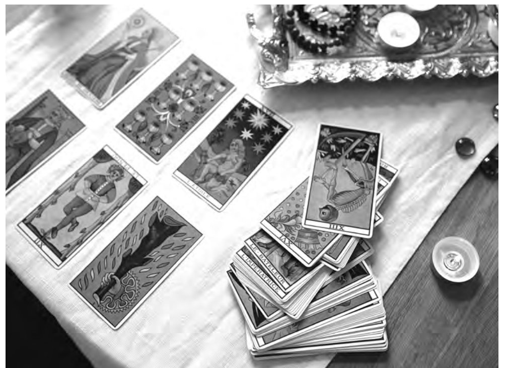
PREVISÕES PARA A SEGUNDA QUINZENA DE DEZEMBRO

Carta Dominante: Valete de Espadas, que significa que deve estar vigilante. Amor: Tendência para ter mais discussões com a sua cara-metade, abra o