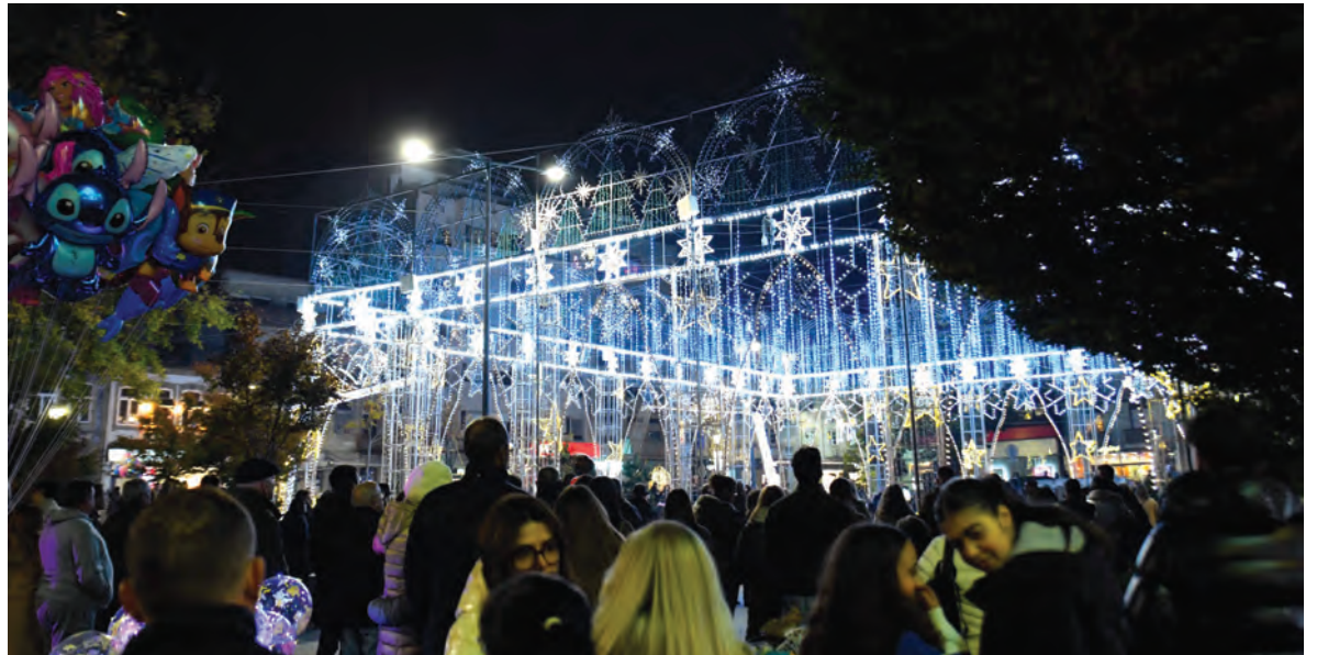
CAMPANHA DE NATAL COM ATRAÇÕES EM TRÊS PRAÇAS DA CIDADE

Em frente ao Mercado Municipal, na Praça Mouzinho de Albuquerque, a Árvore de Natal e a Pista de Gelo prometem momentos de encanto para famílias e visitantes, enquanto a Praça 9 de Abril se transforma na “Praça dos Sonhos”, especialmente