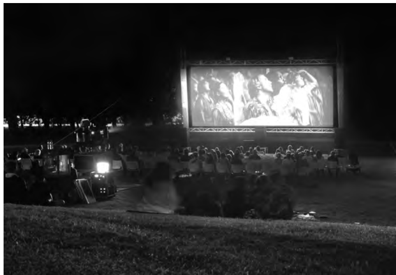
SESSÕES MARCADAS PARA 7, 14, 21 E 28 DE AGOSTO

A proposta cultural traz uma seleção diversificada de filmes, pensada para públicos de diferentes idades e preferências, e reforça a aposta do município de “proporcionar momentos de con-