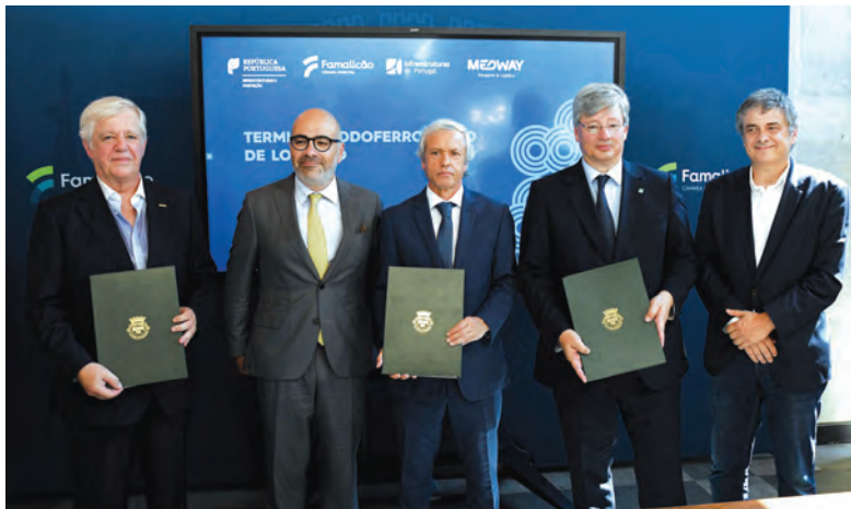
MINISTRO CONSIDERA QUE PROJETO É “UM FATO À MEDIDA” DE FAMILIÇÃO

A adenda ao protocolo assinado inicialmente em 2019 redefine as responsabilidades de cada entidade envolvida, incluindo questões operacionais, cedência de materiais, expropriações, manutenção e compromissos de tráfego. Ao investimento da Medway, avaliado em mais de 60 milhões de euros, juntam-se aproximadamente 11 milhões de euros da Infraestruturas de Portugal (IP) e do Município de Famalicão. O objetivo é desbloquear o processo de construção da maior plataforma de transporte rodoferroviário da Península Ibérica. O novo terminal em Lousado tem a chance da Medway e foi, novamente, formalizado com a assinatura de uma adenda ao Protocolo de Cooperação, numa cerimónia que decorreu no concelho, a 15 de julho, com a presença do ministro das Infraestruturas e Habitação.