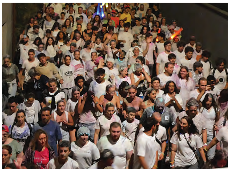
MILHARES DE PESSOAS PARTICIPARAM NA CAMINHADA

da Junta de Freguesia do Coronado, esta foi uma edição especial. “Esta iniciativa começou há cerca de uma década, com o objetivo de