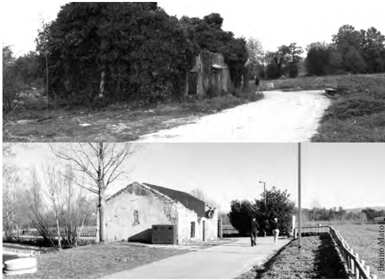
AZENHA DE SAM ANTES E DEPOIS DA INTERVENÇÃO

juntas de freguesia e as associações têm tomado medidas para a valorização deste património. Uma vez promovem intervenções que contribuem para a valorização do património, apoiadas pela conceção do projeto de arquitetura; outras vezes atuam sem o apoio técnico devido e acabam por descaracterizar o património, mesmo quando a intenção pretende ser a melhor. O Município da Trofa tomou o procedimento correto... apesar dos avanços e recuos, acabou por haver vontade e determinação política para recuperar as Azenhas do Ave. Desta forma, os trofenses viram a sua identidade cultural cuidada e valorizada... imagino que isso seja um motivo de orgulho para os utilizadores do Parque das Azenhas. Agora, é necessário dar a devida continuidade, isto é, a utilidade aos edifícios contemplada no projeto de intervenção... a Azenha da Barca contempla um novo espaço expositivo e pedagógico sobre a história e as energias renováveis, onde deveria ser introduzida uma nova turbina hidráulica para o reaproveitamento da energia do rio, microprodução de eletricidade, com fins pedagógicos e ambientais; a ruína da Azenha de Sam está imaginada para ser um “spot” de fotografia da biodiversidade aberto para os fotógrafos de Natureza. É um espaço para observação da biodiversidade preparado para receber exposições temporárias durante o verão sobre a biodiversidade do rio Ave; e, a Azenha de Bairros contempla a reabilitação do edifício e a reconstrução dos engenhos de moagem para atividades educati-