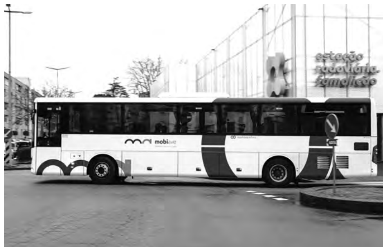
PSP FOI CHAMADA AO LOCAL E REGISTOU A OCORRÊNCIA

O jovem motorista, de 25 anos, acrescenta a associação, manteve a calma e comunicou de imediato com a empresa, solicitando apoio policial. A AIM destaca a “atitude profissional do motorista” e enaltece também “a pronta resposta da entidade empregadora e das forças de segurança”.