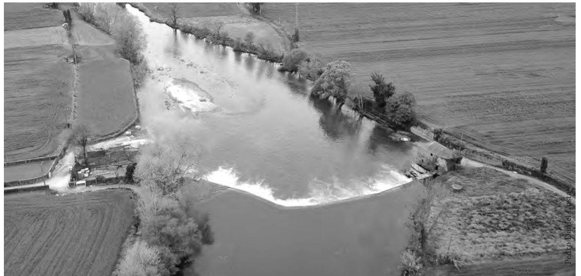
AÇUDE DA AZENHA DE BAIRROS, NA TROFA, E AÇUDE DA AZENHA DE CHAVES, EM FAMILICÃO

Por outro lado, as azenhas, os moinhos e todo o património hidráulico associado ao rio são fundamentais para a valorização da paisagem ribeirinha, quer do ponto de vista do ecossistema biológico, como da dimensão cultural e social. Por exemplo, recentemente convidaram-me para estar em Mértola num debate com a WWF-Portugal sobre um projeto de remoção de um conjunto de açudes na ribeira de Oeiras com o argumento da melhoria da “conectividade fluvial”. Foi muito interessante perceber como esta iniciativa levantou uma enorme contestação por parte do presidente da Câmara de Almodôvar e gerou dúvidas em todos os participantes, nomeadamente nas entidades de tutela ali presentes. Do nosso ponto de vista é interessante compreender como estas estruturas hidráulicas tradicionais têm ainda hoje um papel decisivo da preservação dos ecossistemas ribeirinhos, porque