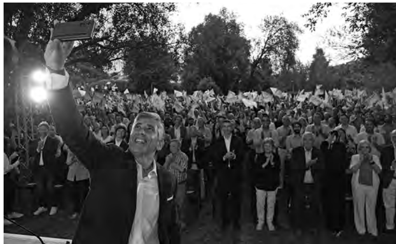
SOCIALISTA APRESENTOU PROJETO POLÍTICO NO PARQUE DE GEÃO

A requalificação dos centros de saúde, num investimento de três milhões de euros, o reforço de apoios como a comparticipação nas próteses dentárias, as consultas de saúde oral nos centros de saúde de S. Tomé de Negrelos e Veiga do Leça e no antigo dispensário de Santo Tirso, a aquisição de óculos e a oferta de vacinas contra a meningite foram algumas das medidas anunciadas para a saúde. Para a população mais velha, uma das