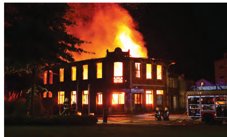
BOMBEIROS CONSEGUIRAM SALVAR 4 GATOS

A Câmara Municipal da Trofa informou, através das redes sociais, que “por motivos de segurança”, a Rua Dr. Adriano Fernandes Azevedo, está cortada ao trânsito na “faixa contígua ao edifício” até à “resolução da ocorrência”, uma vez que a estrutura não reúne condições de segurança. “Considerando a situação, a Rua Dr. Adriano Fernandes Azevedo tem, tempora-