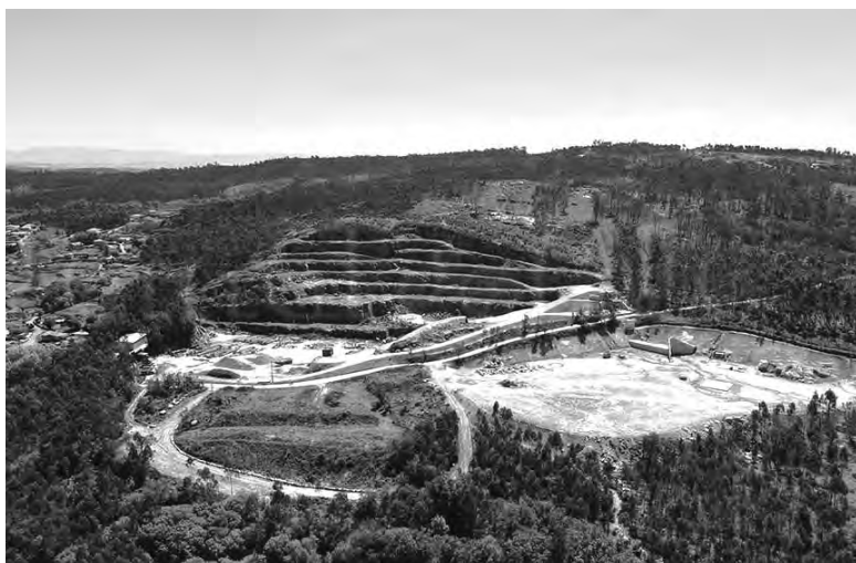
POPULAÇÃO NÃO QUER QUE PEDREIRA VOLTE A FUNCIONAR

Segundo os promotores da ação, está em causa “o regresso de uma ferida antiga”, numa freguesia que classificam como “tranquila”, com cerca de 4 mil habitantes. Os sig-