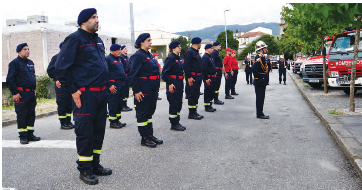
CORPORAÇÃO VIVE MOMENTO DE PROSPERIDADE

Também a mota será adaptada para integrar uma resposta de emergência pré-hospitalar. Segundo o comandante dos