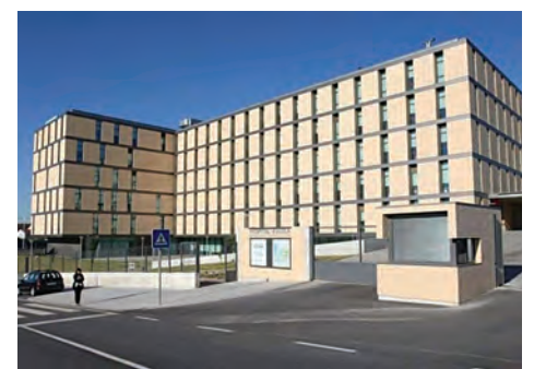
AQUISIÇÃO FOI OFICIALIZADA ESTE MÊS