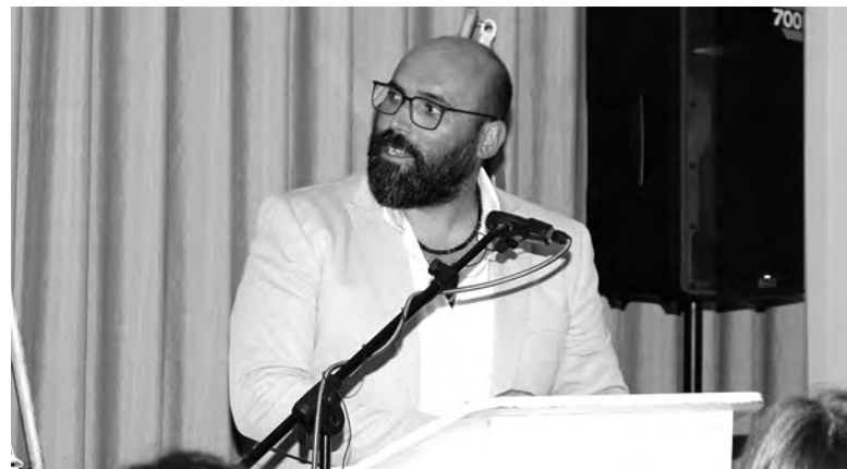
CANDIDATO QUER “DAR VOZ” A QUEM FOI ESQUECIDO

“Quero ser alguém em quem podem confiar”, reforçou, defendendo uma liderança de proximidade, com coragem para “combater compadrios, dizer a verdade e zelar, sem desculpas, pelo interesse da freguesia”.