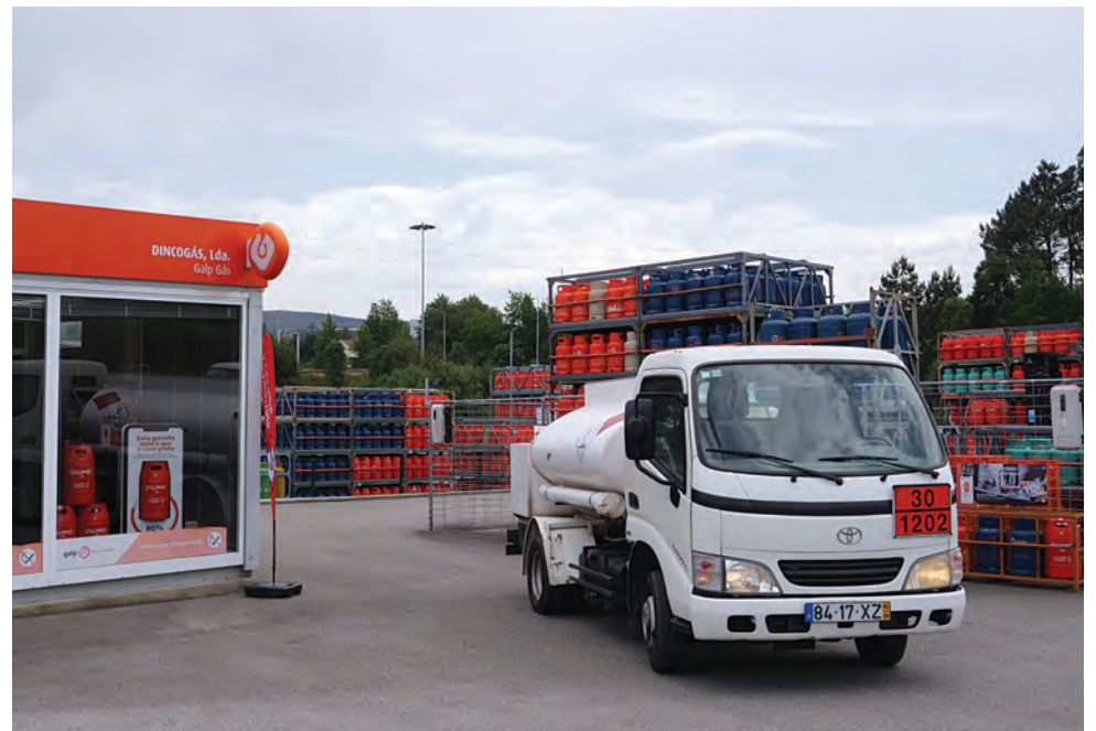
DINCOGÁS FAZ DISTRIBUIÇÃO AO DOMICÍLIO

Para a DincoGás, o contacto direto com o cliente é a base do sucesso. “Noventa por cento do nosso sucesso assenta nessa re-