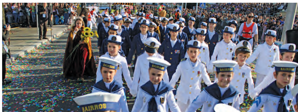
“MARINHEIROS” DE BAIROS ALCANÇARAM 4.º LUGAR