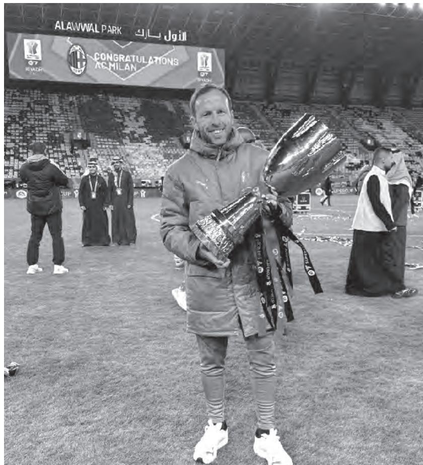
O TREINADOR ADJUNTO DO AC MILAN JÁ CONQUISTOU A SUPERTAÇA DE ITÁLIA

Esta nova etapa no AC Milan representa um salto significativo na carreira do técnico trofense, que se junta a uma equipa repleta de talento internacional. E já teve oportunidade de levantar um troféu: a Supertaça italiana, conquistada poucos dias depois de chegar à equipa.