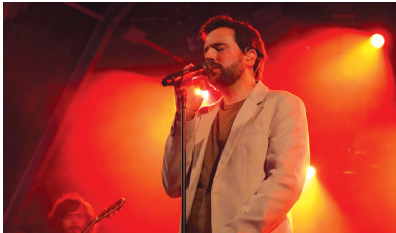
ARTISTA LANÇOU ÁLBUM COM DEZ CANÇÕES