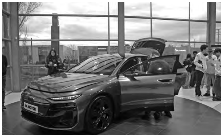
AUDI A6 É A O PRIMEIRO MODELO 100% ELÉTRICO

vel, o evento serviu também para apresentar a equipa S-Energy, composta por alunos do Agrupamento de Escolas Benjamim Salgado e do Instituto Nun'Álvares, que participam na competição internacional F1 in Schools e que contam com o apoio da BL Motor. Este concurso desafia estudantes a desenvolver um projeto completo de criação de uma equipa de Fórmula 1, envolvendo não só a construção de um protótipo, mas também a vertente organizacional, de marketing e gestão de patrocinadores.