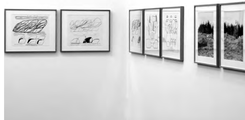
MOSTRA ESTÁ PATENTE ATÉ 14 DE JUNHO