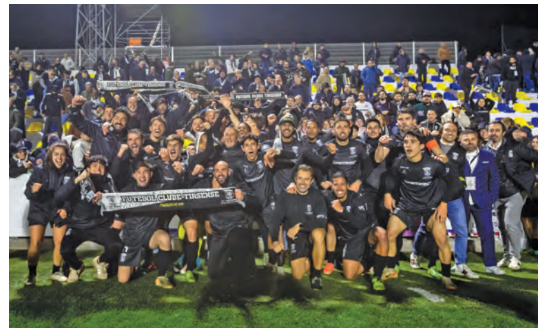
VOTO EXPRESSA O RECONHECIMENTO AOS ATLETAS, TREINADORES E DIRIGENTES

bui para a valorização da identidade do município e para a promoção da prática desportiva junto das camadas mais jovens. No voto de saudação, a Câmara de Santo Tirso expressa o seu reconhecimento público aos atletas, treinadores e dirigentes do FC Tirsense, enaltecendo o esforço e dedicação que permitiram alcançar esta fase histórica. Independentemente do que acontecer na próxima eliminatória, agenda para abril, o executivo municipal acredita que esta equipa já deixou uma marca na história do clube e do concelho.