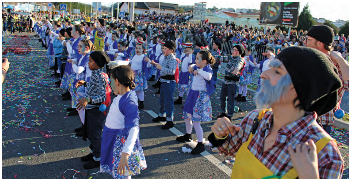
“PESCADORES” DO PARANHO CONQUISTARAM O JÚRI na “Marilu”.

O Carnaval da Trofa não foi apenas uma competição entre as escolas, mas também um evento que envolveu toda a comunidade. Muitos foliões juntaram-se ao desfile, competindo por um prémio. O grande vencedor foi o grupo “Vale as ajudas”, que apresentou uma sátira à fuga da prisão de Vale de Judeus. Em 2.º lugar ficou o grupo “Mamála do Pipy” e em 3.º o grupo “Motomecânica Rodas da Trofa”. O top 5 da categoria de foliões foi completado com o grupo “Santa Misericórdia Nesta Casa” e a matrafo-