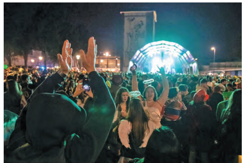
CARNAVAL ENCHEU AS RUAS DE FAMILIÇÃO

Mas a festa não se resumiu apenas à noite de 3 para 4 de março. Durante vários dias, Famalicão viveu o Carnaval em diferentes momentos, desde o desfile infantil que coloriu a cidade no dia 28 de fevereiro, à exposição de Máscaras e Caretos inaugurada