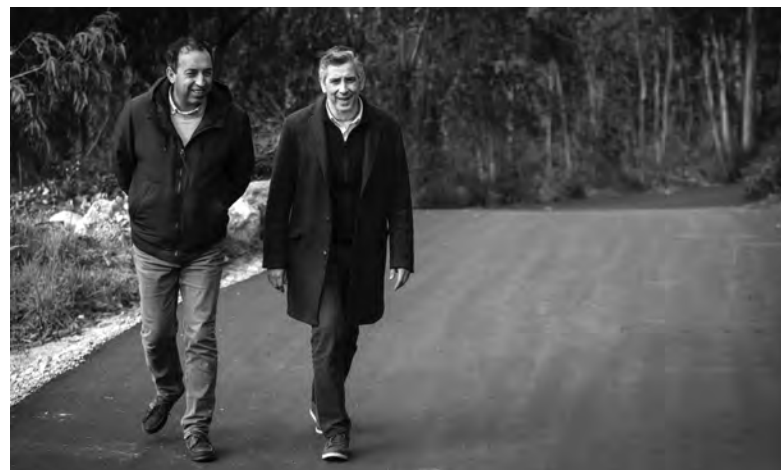
AUTARQUIA TRANSFERIU 630 MIL EUROS PARA A JUNTA DE FREGUESIA

O presidente da Câmara também visitou as obras em curso na Rua Monsenhor José Ferreira e a manutenção dos cruzei-