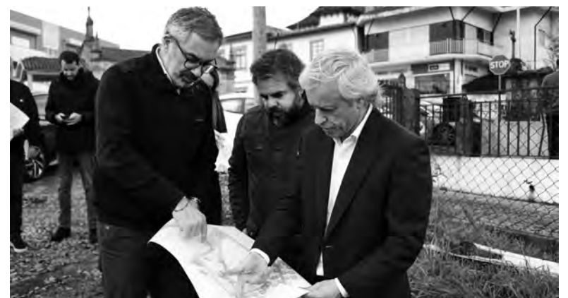
NOVO PARQUE TERÁ 6000 METROS QUADRADOS