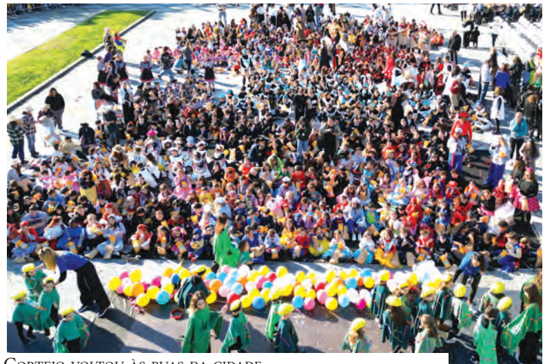
CORTEJO VOLTOU ÀS RUAS DA CIDADE

O autarca destacou ainda a importância da iniciativa para incluir e unir gerações: “Isto é transversal a todas as idades. É claro que promovemos muito pelos mais pequenos, para manter viva a tradição, mas também pelos idosos, neste encontro intergeracional. O que se faz aqui é extraordinário, está à vista de todos, e quando assim é vale a pena investir”.