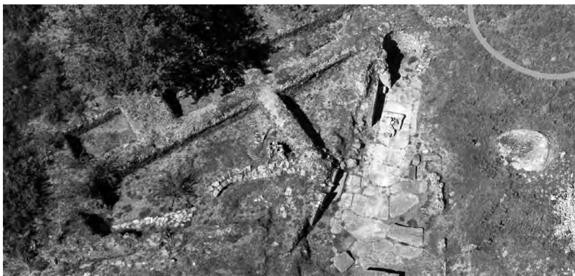
VISITA ACONTECE NO PRÓXIMO DOMINGO

O Conjunto Arqueológico das Eiras é um testemunho singular da ocupação humana desde o final do Neolítico até à Idade Média. Entre os seus elementos mais notáveis estão o Castro das Eiras, um dos maiores povoados da Idade do Ferro no Norte de Portugal, com um balneário decorado com pedras graníticas; o Castro de Vermoim, com vestígios defensivos medievais do antigo castelo local; e a Necrópole