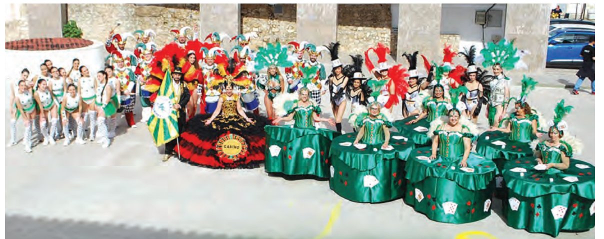
GRUPO TIRSENSE DESFILOU NO CARNAVAL MAIS ANTIGO DO PAÍS