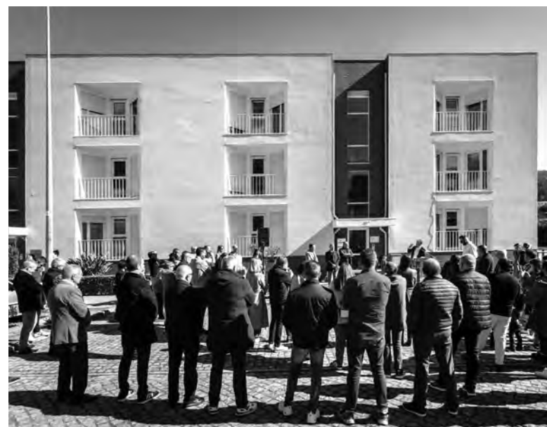
REQUALIFICAÇÃO PERMITIU DAR CASA A CINCO NOVAS FAMÍLIAS

“Durante o primeiro semestre de 2025”, deverão ser entregues “mais 34 habitações, das reabilitações atualmente em fase de conclusão”, anunciou.