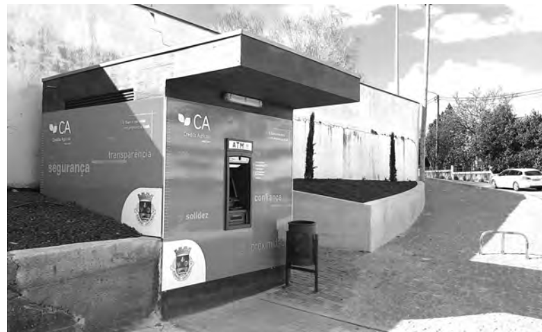
SERVIÇO INSTALADO NO PARQUE DE ESTACIONAMENTO DO CEMITÉRIO

A instalação contou com o apoio da Caixa de Crédito Agrícola do Médio Ave, reforçando o compromisso de proximidade e serviço à comunidade, e concretiza mais um objetivo da Junta de Freguesia de Rebordões.