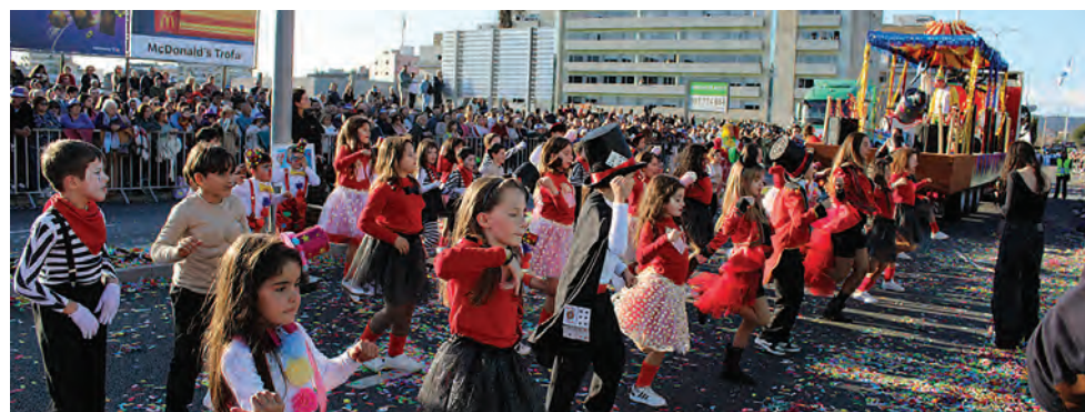
LAGOA APRESENTOU-SE COM A ARTE CIRCENSE E FICOU EM 5.º