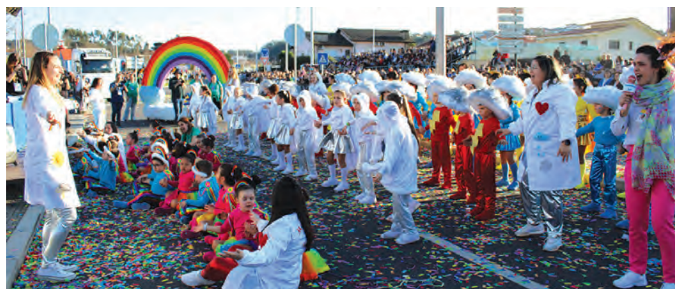
PÓDIO FICOU COMPLETO COM “METEOROLOGISTAS” DE PARADELA