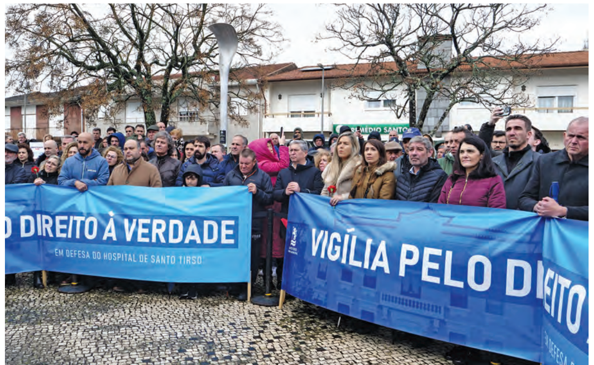
320 TRABALHADORES ASSINARAM ABAIXO-ASSINADO PARA ENTREGAR À MINISTRA DA SAÚDE

Durante a vigília, um grupo de profissionais do hospital entregou um abaixo-assinado a Alberto Costa para que este