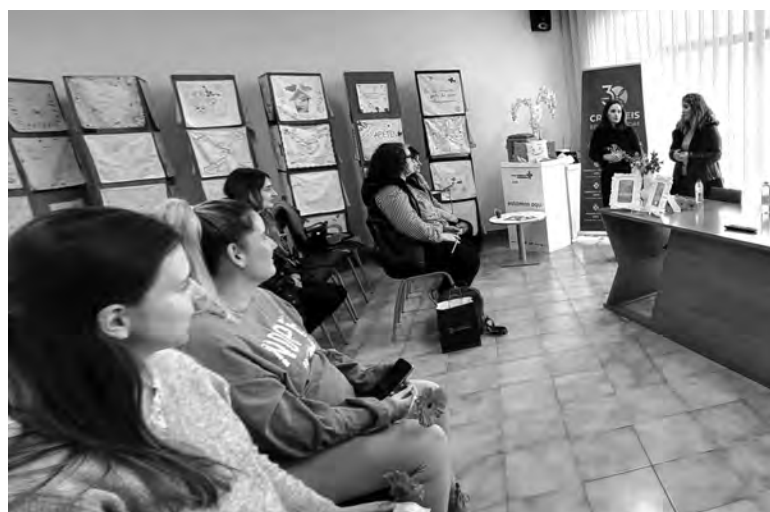
A LUST REFORÇA O SEU COMPROMISSO COM A PROMOÇÃO DA SAÚDE

As participantes foram apresentadas com uma oferta da Farmácia Trofense. A LUST, através destas ações, reforça o seu compromisso com a promoção da saúde na comunidade, disponibilizando momentos de aprendizagem e partilha sobre temas relevantes. Criada em dezembro de 2023, esta associação tem como outros objetivos representar e proteger os interesses e direitos dos utentes inscritos nas unidades de saúde do concelho da Trofa e promover a adequada utilização dos serviços e recursos de saúde.