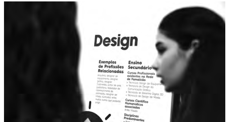
INICIATIVA DECORRE NO FAMILIÇÃO IN HUB

A feira destaca as diversas opções de ensino disponíveis no concelho, desde o ensino regular até à formação profissional, permitindo aos alunos conhecer de forma prática e dinâmica a ofer-