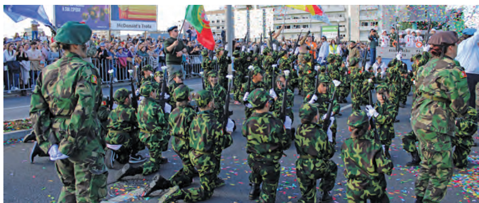
ESCOLA DE FEIRA NOVA CONQUISTOU O 2.º LUGAR

“Estamos a analisar a possibilidade de mudar a localização para um espaço que garanta a acomodação de muito público, e a FAPTrofa está a trabalhar na melhor solução para isso”, concluiu António Azevedo.