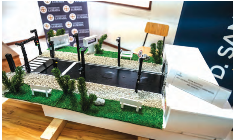
UM DOS PROJETOS VENCEDORES