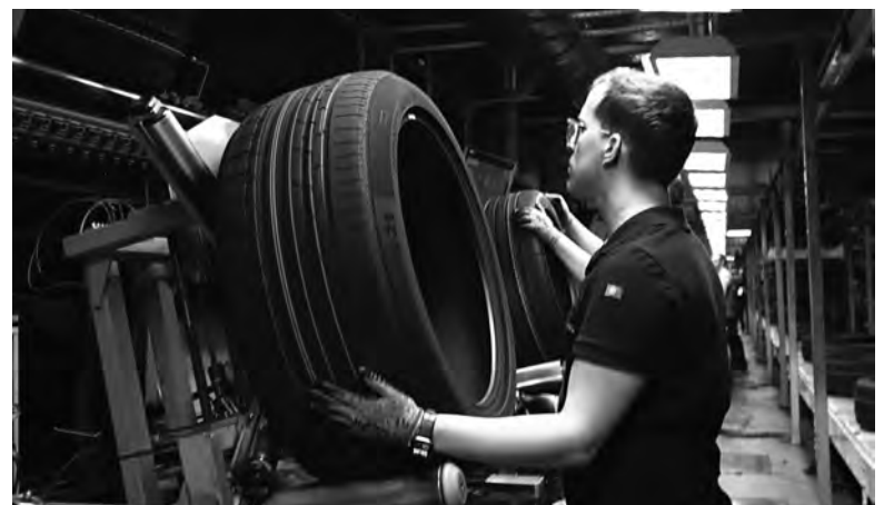
CONTINENTAL É A 3.ª EMPRESA COM MAIS REPUTAÇÃO NA INDÚSTRIA