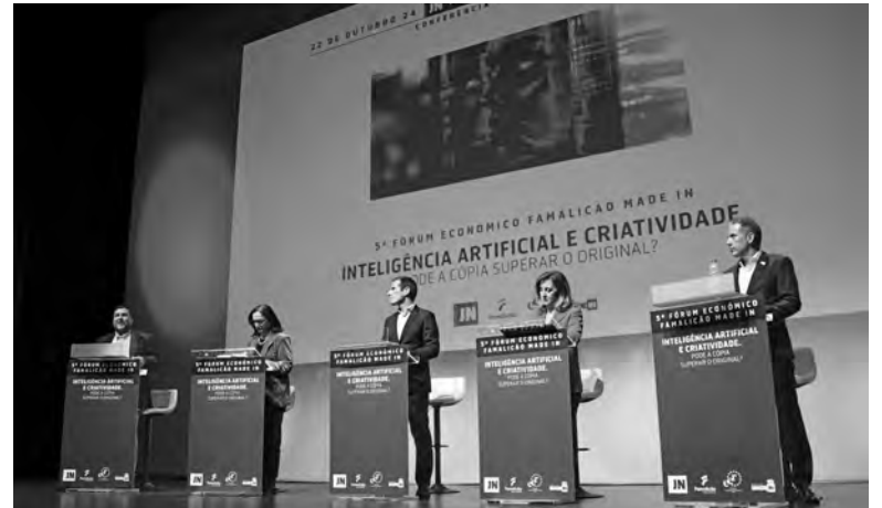
INICIATIVA JUNTOU EMPRESÁRIOS E COMENTADORES