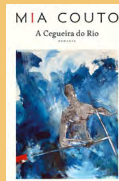
A CEGUEIRA DO RIO DE MIA COUTO

O primeiro incidente militar numa aldeia do Norte de Moçambique marca, em agosto de 1914, o início da Primeira Guerra Mundial no continente africano. Esse inesperado episódio despoleta, para além disso, uma série de misteriosos eventos que culminam com o desaparecimento da escrita no mundo. Livros, relatórios, documentos, fotografias, mapas surgem deslavados e ninguém mais parece ser capaz de dominar a arte da escrita. Os habitantes dessa aldeia são chamados a restabelecer a ordem no mundo, ensinando aos europeus o ofício da escrita e as artes da navegação.