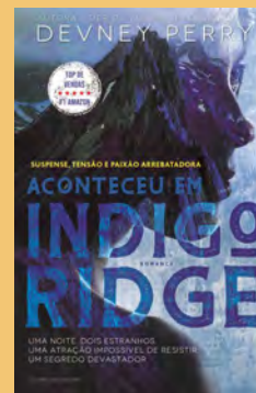
ACONTECEU EM INDIGO RIDGE DE DEVNEY PERRY

O primeiro incidente militar numa aldeia do Norte de Moçambique marca, em agosto de 1914, o início da Primeira Guerra Mundial no continente africano. Esse inesperado episódio despoleta, para além disso, uma série de misteriosos eventos que culminam com o desaparecimento da escrita no mundo. Livros, relatórios, documentos, fotografias, mapas surgem deslavados e ninguém mais parece ser capaz de dominar a arte da escrita. Os habitantes dessa aldeia são chamados a restabelecer a ordem no mundo, ensinando aos europeus o ofício da escrita e as artes da navegação.