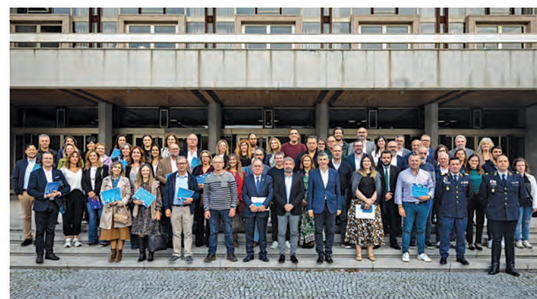
OBJETIVO DA CARTA É PROMOVER A EQUIDADE EM VÁRIAS ÁREAS de outubro por várias organizações em Portugal, reforçando os valores de igualdade, inclusão e participação.

Desde 2010, o Dia Municipal para a Igualdade é celebrado a 24