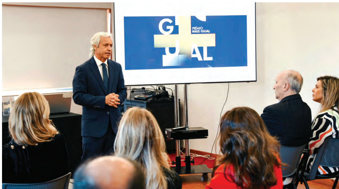
FAMALICÃO TAMBÉM PREMIOU EMPRESAS E INSTITUIÇÕES POR PAPEL DESEMPENHADO NA PROMOÇÃO DA IGUALDADE

“Como é sabido, a igualdade é fundamental para a coesão social”, afirmou o autarca, que destacou que Famalicão tem realizado progressos significativos nas políticas públicas dirigidas à igualdade. “Receber o ‘Prémio + Igual’ é uma confirmação de