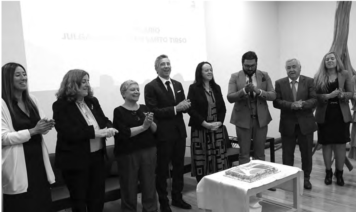
JULGADO DE PAZ É UMA “EXPERIÊNCIA DE SUCESSO”

O Julgado de Paz de Santo Tirso assinalou o primeiro ano de atividade com 59% dos processos resolvidos por acordo entre as partes, enquanto 14% foram concluídos com uma sentença. Este serviço de justiça de proximidade, com sede no edifício da central de transportes, registou até agora 47% de processos de responsabilidade civil contratual e extracontratual, grande parte dos quais relacionados com acidentes de viação e empreitadas. A maior parte dos casos que entraram no Julgado de Paz envolviam um valor entre os 2500 e 15 mil euros.