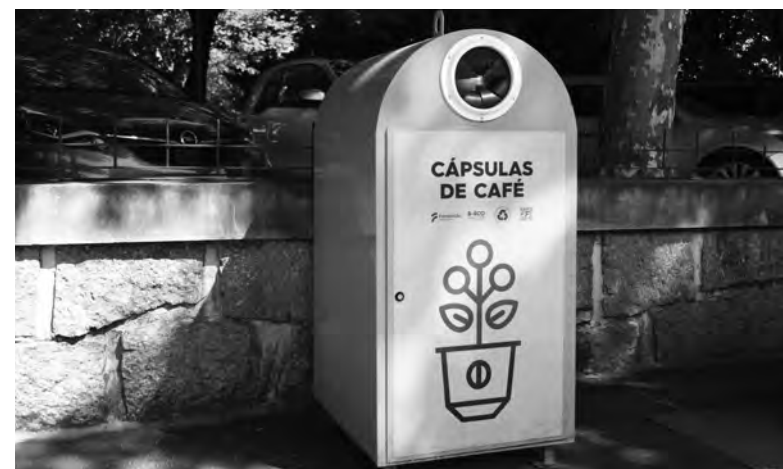
EXISTEM AGORA MAIS DE 30 CAPSULÕES NO CONCELHO

Os famalicenses que queiram reciclar estes materiais devem inserir as cápsulas de café usadas num saco de plástico fechado, dirigir-se a um dos capsulões disponíveis em todo o concelho e depositá-lo dentro do equipamento. A localização dos capsulões pode ser consultada no site do município, em www.famalicao.pt/recolha-de-capsulas-de-cafe .