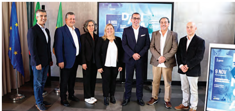
EVENTO É APOIADO PELA AUTARQUIA