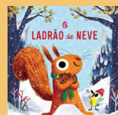
O LADRÃO DE NEVE DE ALICE HEMMING

Histórias que destapam aquilo que fomos e somos enquanto democracia, que nos expõem a pequenez, o imprevisto, as vistas curtas, a pompa risível e a circunstância balofa, as contradições, o ridículo e a falta de noção. Pode não ser grandioso, mas é divertido. Ou constrangedor.