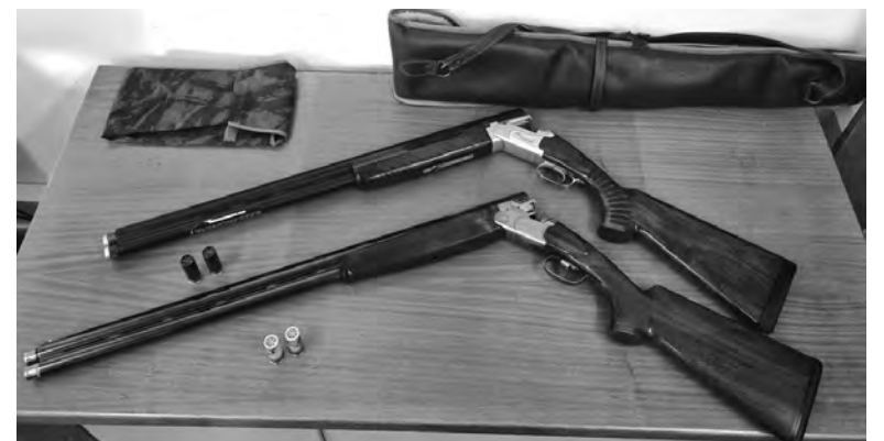
CAÇADORES COM ARMAS E CARTAS APREENDIDAS

“A GNR relembra que, entre outros locais, constituem áreas de proteção (áreas onde o exercício da caça pode causar peri-