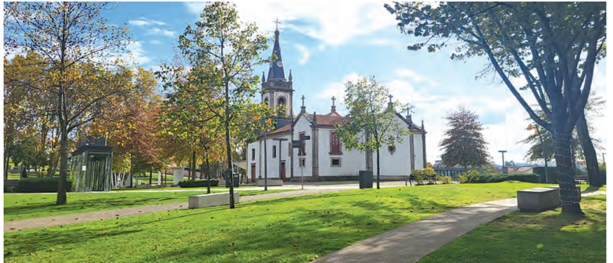
HABITUAL VITELA ASSADA É SERVIDA NO PARQUE NOSSA SENHORA DAS DORES E DR. LIMA CARNEIRO

No próximo dia 19 de novembro, terça-feira, a Trofa comemora o 26.º aniversário da elevação a concelho. A programação tem início às 10h30, com uma sessão solene, no Auditório do Fórum Trofa XXI, no Parque Nossa Senhora das Dores e Dr. Lima Carneiro.