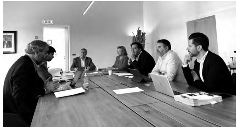
PROPOSTA DE ORÇAMENTO FOI APROVADA COM ABSTENÇÃO DOS ELEITOS DO PS

O aumento significativo do orçamento em comparação a 2024 deve-se, essencialmente, ao proje-