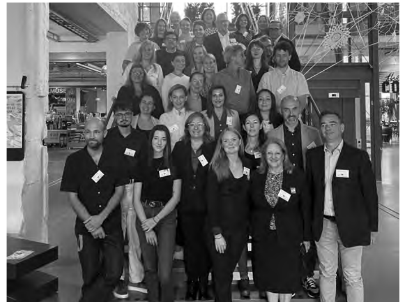
AUTARQUIA TIRSENSE ESTEVE REPRESENTADA EM BORAS

A participação de Santo Tirso no projeto, através do Invest Santo Tirso, tem como objetivo alinhar as políticas municipais com as diretivas europeias,