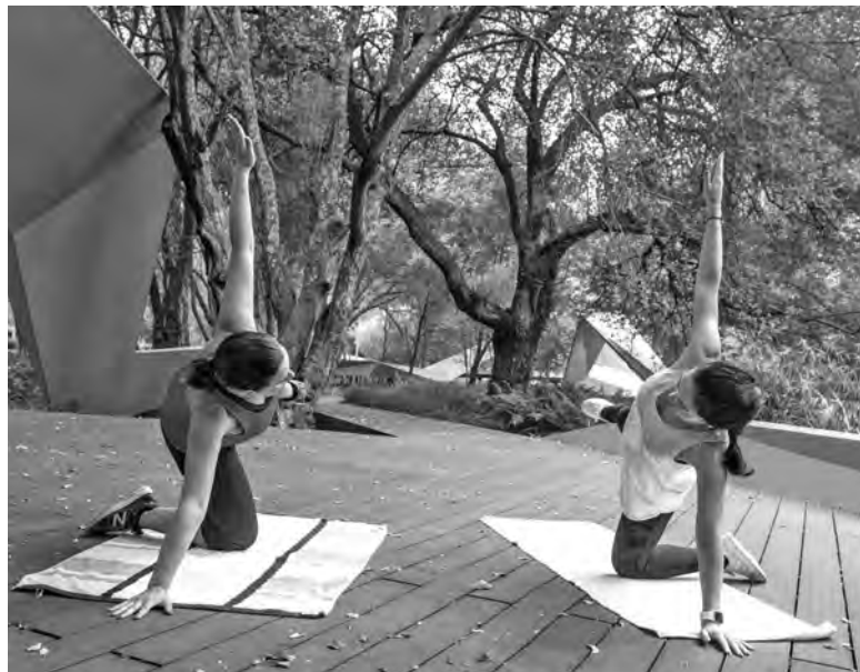
AULAS EM VILA DAS AVES COMEÇAM EM OUTUBRO

As aulas, dirigidas por profissionais especializados, incluem exercícios seguros tanto para a mãe como para o bebé. O programa foca-se em melhorar a aptidão muscular e cardiorrespirató-