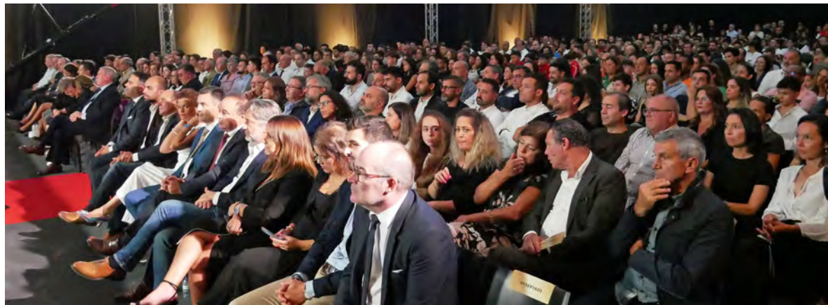
GALA REALIZOU-SE NO PAVILHÃO DA EB 2/3 PROFESSOR NAPOLEÃO SOUSA MARQUES