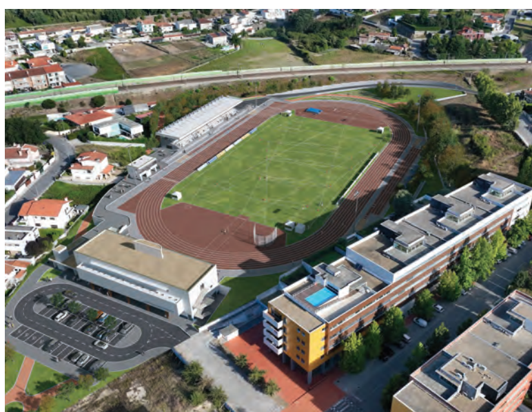
OBRA ESTÁ AVALIADA EM MAIS DE 6 MILHÕES DE EUROS

Famalicão, que já é o concelho com mais atletas federados no distrito, pretende assim afirmar-se ainda mais no pano-