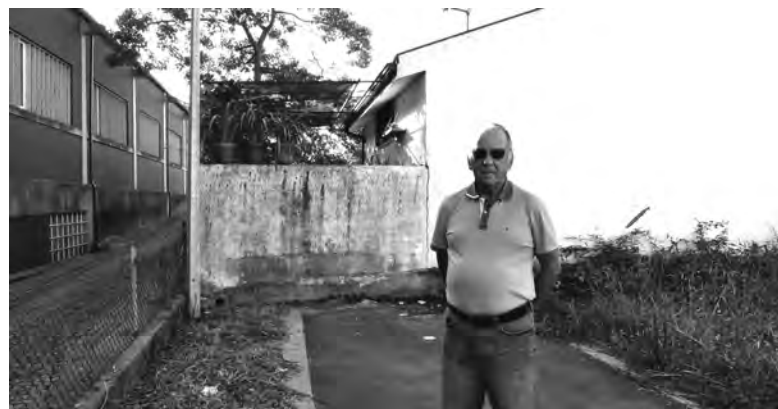
JUIZ NÃO CONSEGUIU APURAR DE QUEM É A PARCELA DE TERRENO

“Nunca ninguém falou comigo, para chegar a um acordo. A primeira carta que eu recebi, foi logo de ameaças que vinham deitar isto abaixo, com a agravante de a terem enviado para uma morada onde eu já não resido há mais de 30 anos. O vizinho, que teve o mesmo problema, veio falar comigo sobre a carta e eu disse que não sabia de nada. Passados cerca de dois meses, recebo uma segunda carta a ameaçar-me por não ter cumprido o que estava determinado no primeiro ofi-