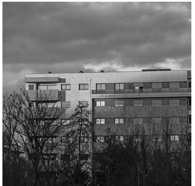
CÂMARA VAI AUMENTAR APOIOS E CRIAR NOVO ESCALÃO

Para mais informações ou esclarecimento de dúvidas, os interessados podem contactar a Câmara Municipal através do email rendas@famalicao.pt ou dos contactos telefónicos 252 320 900 / 800 292 827 (chamada gratuita).