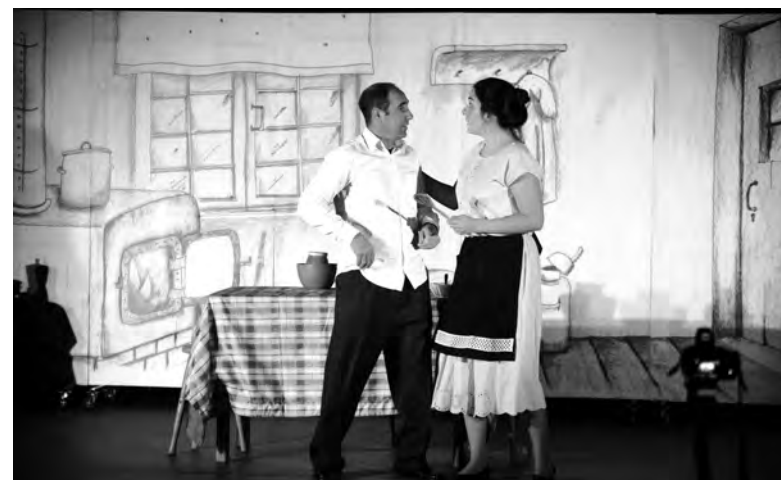
ESTA É A 8.ª EDIÇÃO DA INICIATIVA CULTURAL ITINERANTE

A programação completa do evento está disponível no site oficial do município em www.famalicao.pt . Desde o seu lançamento em 2015, o “Teatro N’Aldeia” tem vindo a afirmar-se como um