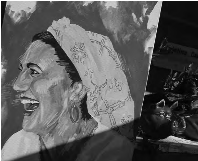
EVENTO DECORRE NA PRAÇA MOUZINHO DE ALBUQUERQUE

A programação de sábado inclui atividades para toda a família.