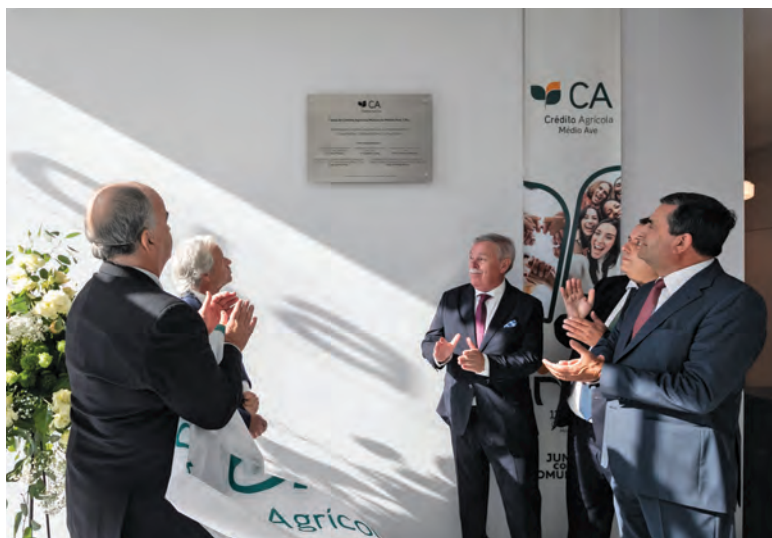
INAUGURAÇÃO MARCOU ANIVERSÁRIO DA INSTITUIÇÃO

Com ação social nos concelhos de Famalicão, Trofa e Santo Tirso, a instituição, que assim celebrou os 111 anos de existência, defende que a matriz cooperativa confere-lhe “uma natureza ímpar alicerçada nos valores da solidariedade, da ética, da modernidade e solidez”. São vários os projetos apoiados pela Cai-