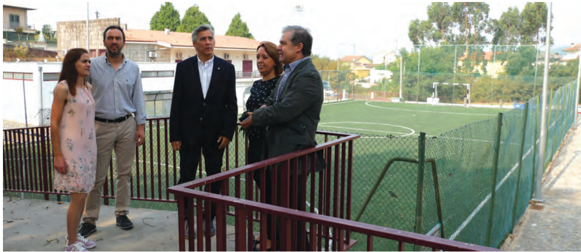
JUNTA DE FREGUESIA SATISFEITA COM APOIO DADO PELA CÂMARA MUNICIPAL

A empreitada visará toda a área do equipamento, edifício principal, pavilhão gimnodesportivo, campo de jogos e espaço exterior. A previsão é que a obra es-