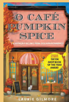
O CAFÉ PUMPKIN SPICE DE LAURIE GILMORE

Um dia, porém, recebem a visita inesperada e indesejada da avó da Hungria, trazendo consigo dias cinzentos e segredos do passado que fazem desmoronar o mundo de Billie.