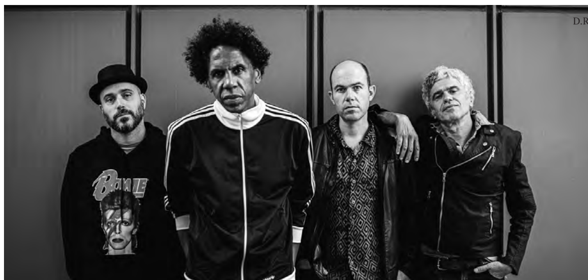
CONCERTO ESTÁ MARCADO PARA 4 DE OUTUBRO

energia explosiva e libertadora da banda em palco, promete ser um momento de catarse e celebração, ideal para exorcizar problemas e fantasmas através de uma tempestade de som.