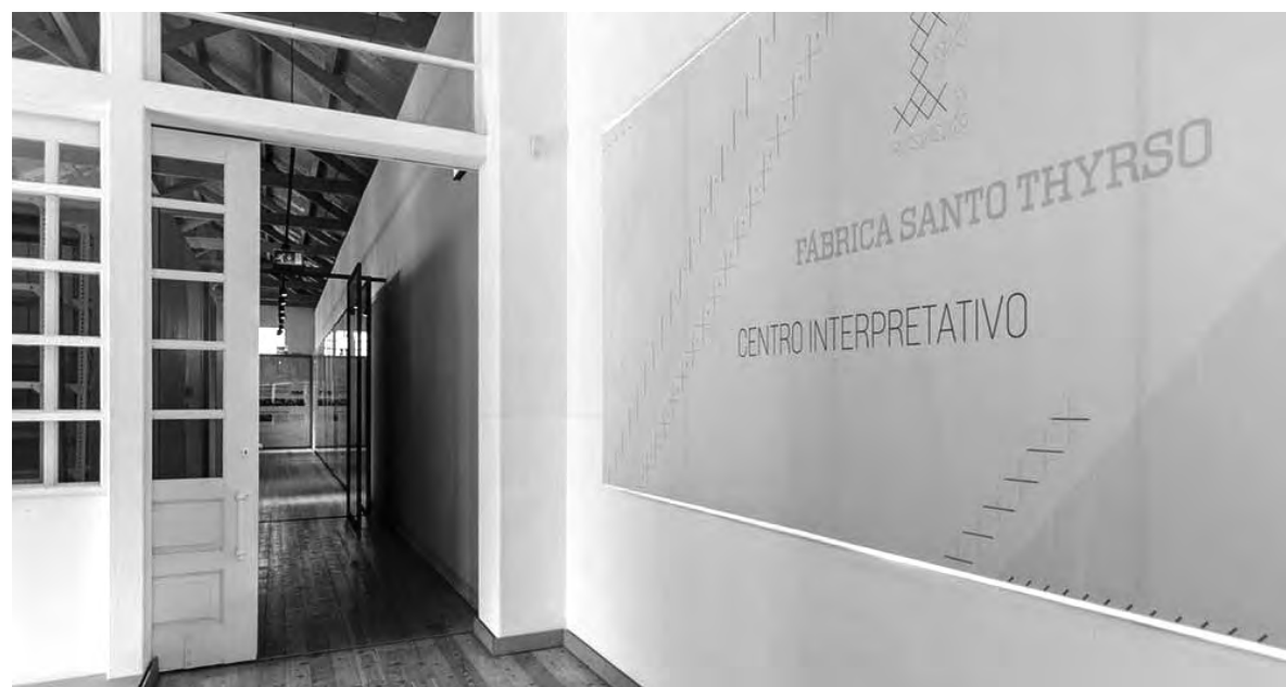
SESSÕES DECORREM ATÉ FEVEREIRO