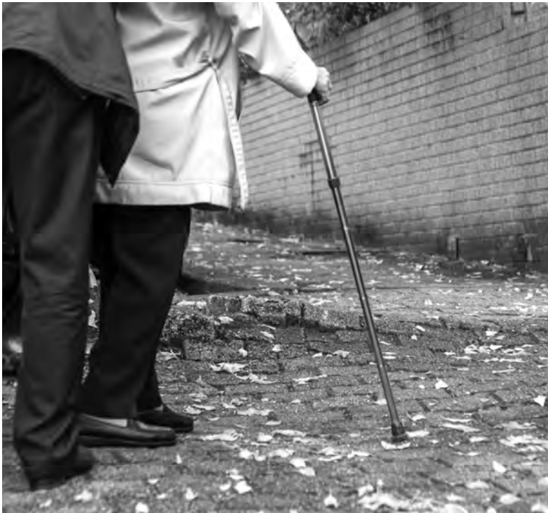
ÁRVORES PÔEM EM CAUSA “SEGURANÇA” DOS PEÕES, DIZ AUTARQUIA

O assunto levantou algum sururu e obrigou a autarquia enviar uma nota informativa. Dez árvores vão ser abatidas na Avenida de França, na cidade de Vila Nova de Famalicão, devido ao “estado avançado de declínio e fragilidade” em que se encontram, justificou a Câmara Municipal.