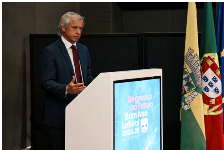
AUTARCA QUER “EDUCAÇÃO CADA VEZ MAIS QUALIFICADA”

No início deste novo ano escolar, mais de 18 mil alunos regressaram às 139 escolas do concelho, distribuídos por 775 turmas. O crescimento nas inscrições, especialmente no pré-escolar e no 1.º Ciclo, que registou um aumento de 165 alunos, motivou a antecipação da revisão da Carta Educativa “Educa 20.30”, prevista inicialmente para 2025/2026. Serão criadas novas salas de educação pré-escolar e sete novas turmas no 1.º Ciclo, para responder a esta tendência.