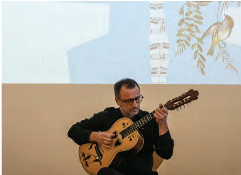
INICIATIVA DECORRE DE 16 A 20 DE OUTUBRO