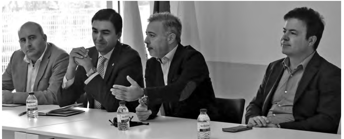
LÍDER DISTRITAL DO PSD CONSIDERA QUE SANTO TIRSO ESTÁ ESTAGNADO

Na iniciativa que decorreu em Água Longa, Pedro Duarte descartou, “por agora”, a candidatura à Câmara Municipal do Porto nas eleições autárquicas de 2025 e assegurou que está focado na sua missão no Governo, como ministro dos Assuntos Parlamentares.