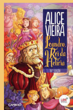
LEANDRO, REI DA HELÍRIA DE ALICE VIEIRA

Esta obra analisa as novas paisagens ideológicas e oferece uma série de pistas para entender o comportamento dos atores políticos e sociais. Aqueles que, em nome da liberdade, fazem o que lhes apetece, ignorando o impacto das suas ações, contribuem para formar uma sociedade em que muitos veem reduzidas as suas possibilidades de escolha.