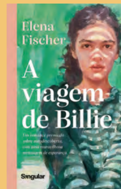
A VIAGEM DE BILLIE DE ELENA FISCHER

Billie, de 14 anos, mora com a mãe, Marika, no 17.º andar de um arranha-céus, num bairro social, do qual raramente sai. Apesar das dificuldades financeiras que se agravam no final de cada mês, Marika esforça-se por adoçar e animar o dia a dia da filha com a sua imaginação fértil e um coração de ouro.