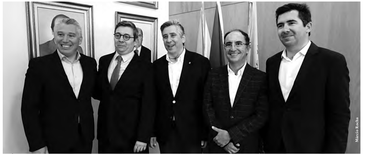
ÓRGÃOS SOCIAIS DA ACIST TOMARAM POSSE A 8 DE MAIO

“Gostaria de destacar o projeto do ‘Bairro Comercial Digital’,