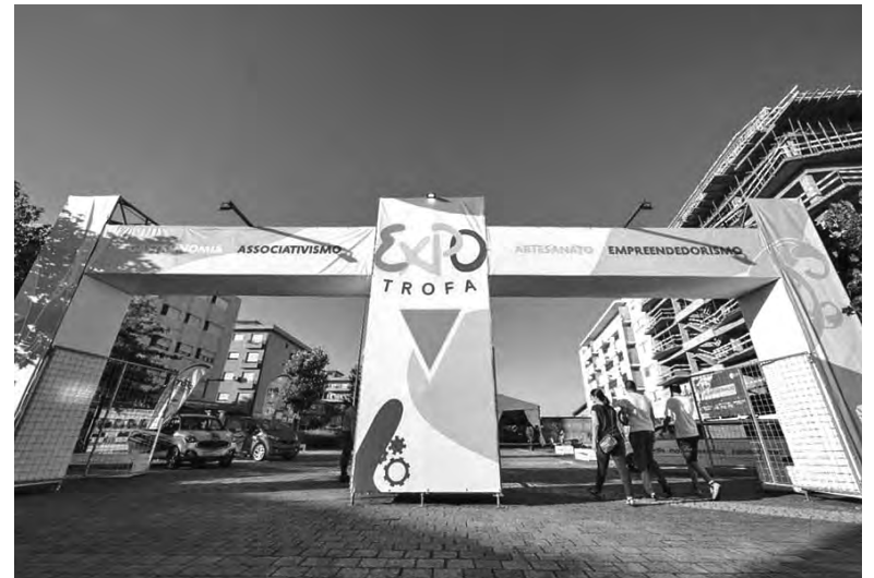
EVENTO DECORRE DE 3 A 7 DE JULHO

Emanuel é também cabeça de cartaz do evento e tem concerto marcado para 6 de julho.