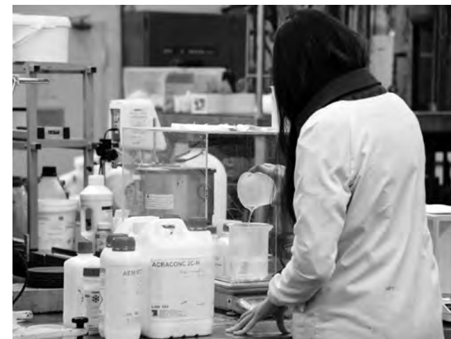
AUTARQUIA TEM 5 PRÉMIOS DE 5000 EUROS PARA ENTREGAR

O formulário de candidatura e toda a informação regulamentar sobre o programa está disponível no site Famalicão MadeIN ( www.famalicao-madein.pt ). As candidaturas são permitidas apenas a investigadores e bolseiros com projetos de investigação em curso, aprovados por instituições oficiais, nacionais ou internacionais. B.S./C.V.