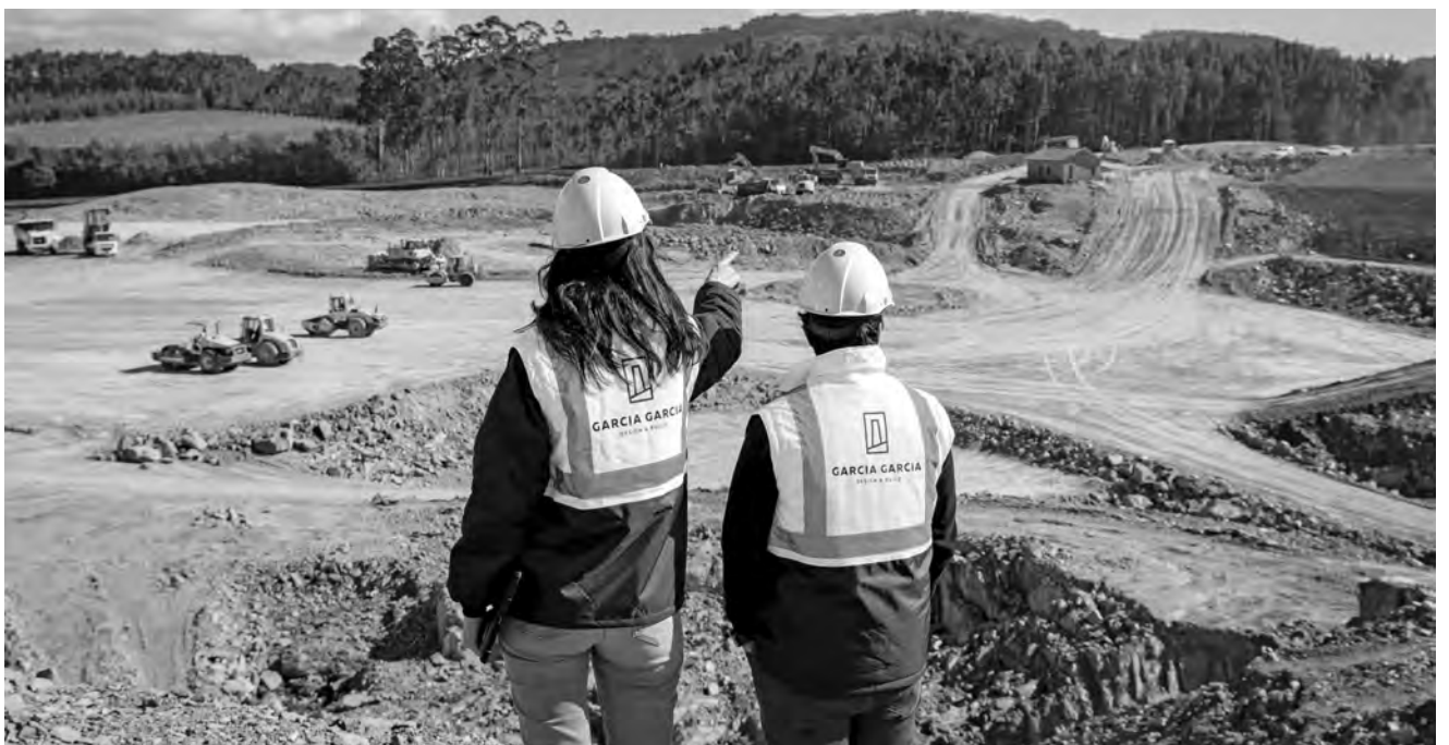
EMPRESA FATUROU MAIS DE CEM MILHÕES DE EUROS O ANO PASSADO