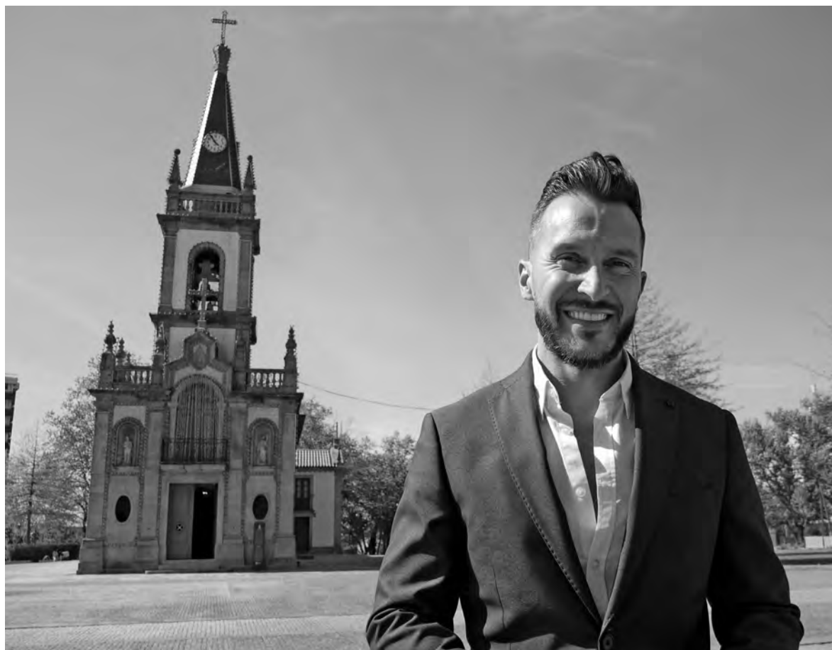
CANTOR TEM SIDO PRESENÇA ASSÍDUA EM PROGRAMAS DE TELEVISÃO

“Ao fim de muitos anos de frustração, e de muitos altos e baixos, nunca perdi a vontade de querer fazer e de querer fazer sem-