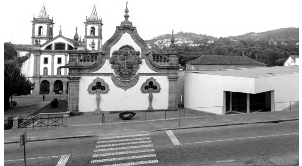
AUTARQUIA ORGANIZA SEMANA DOS MUSEUS COM EXTENSA PROGRAMAÇÃO

A Câmara Municipal de Santo Tirso organiza, de 18 a 25 de maio, a Semana dos Museus, com uma extensa programação que engloba concertos, workshops e outras atividades. A iniciativa concentra-se no Museu Interacional de Escultura Contemporânea (MIEC) e no Centro de Arte Alberto Carneiro (CAAC).