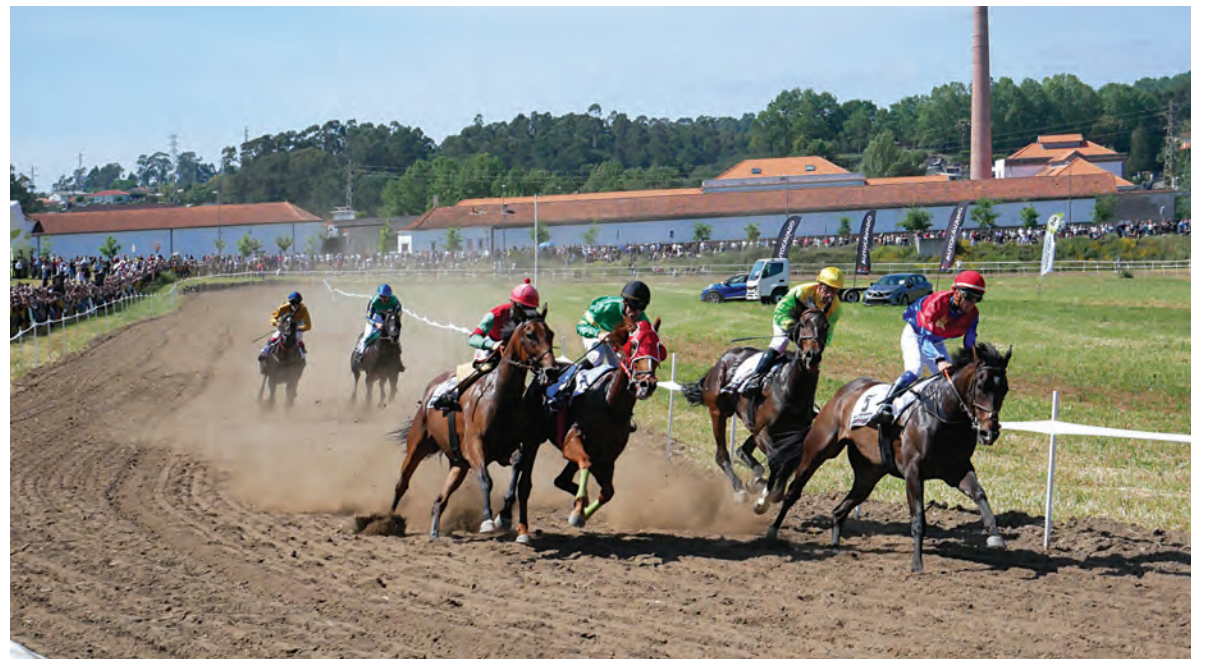
SANTO TIRSO RECEBEU PROVA DE CAVALOS MAIS DE 30 ANOS DEPOIS

“Cerca de 50% dos nossos proprietários têm cavalos que correm a nível nacional e internacional, os feitos destes proprietários a nível internacional têm