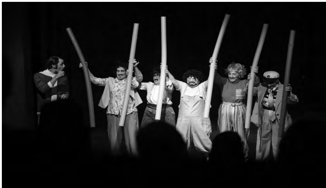
INICIATIVA TERÁ CINCO ESPEÁCULOS

Publicada em 1846 por Almeida Garrett, esta comédia oferece como ambiente a cidade de Lisboa em pleno século XIX, mostrando o refinado sentido de humor do reconhecido autor português. A peça pretende ainda criar caminho para a reflexão crítica sobre a sociedade da época.