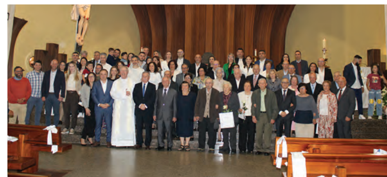
CASAIS CELEBRARAM BODAS MATRIMONIAIS

realizou a bênção dos casais que celebram, este ano, dez, 25, 50 e 60 anos de casamento. Presidiu a estes eventos religiosos o pároco Luciano Lagoa e participaram várias dezenas de casais e muitos familiares que quiseram tomar parte nestas cerimónias religiosas.