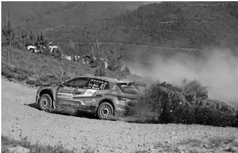
OGIER TEVE A SEXTA VITÓRIA NO RALLY DE PORTUGAL

No rescaldo do triunfo mais importante, que ainda assim lhe deu menos pontos que o 2.º classificado na geral, Sébastien Ogier reconheceu as “boas sensações” de conseguir superar o recorde de vitórias no Rally de Portugal. “Há anos que me pergunta-