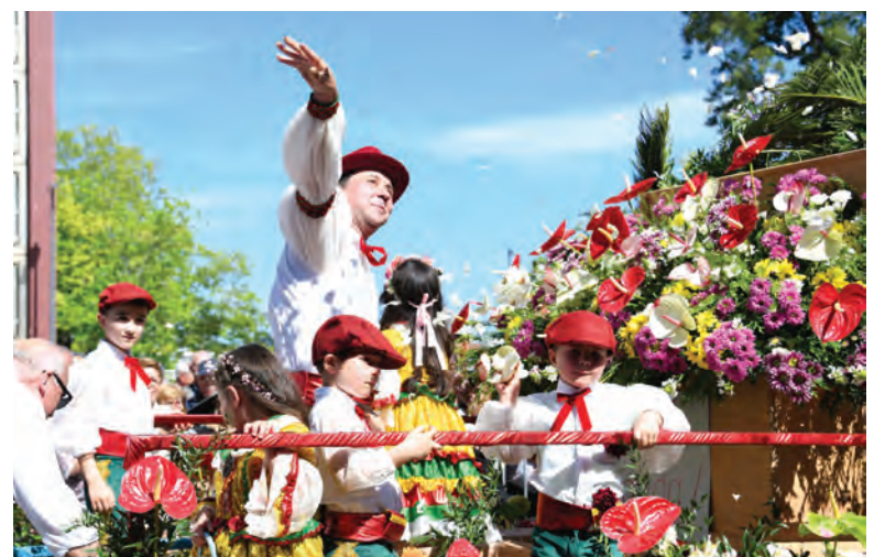
EVENTO CADA VEZ MAIS IMPORTANTE NO CALENDÁRIO DO CONCELHO

A Festa da Flor transformou o centro de Famalicão num espaço de convívio intergeracional e intercultural, com mercado de flores e plantas, produtos locais, tasquinhas, arte, música e animação de rua.