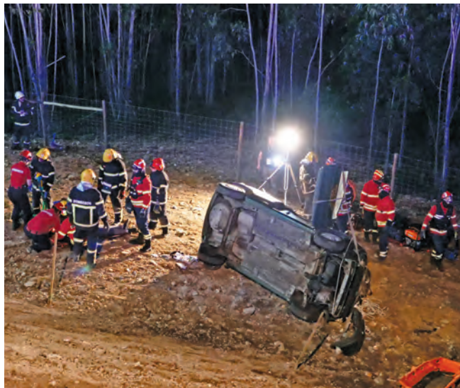
SIMULACRO ACONTECEU NA FUTURA VARIANTE À EN14

Num exercício em que também a população foi convidada a assistir, estiveram também presentes representantes da Autoridade Nacional de Emergência e Proteção Civil, através do Comando Sub-Regional da Área Metropolitana do Porto, a GNR, a Polícia Municipal e elementos da construtora Gabriel Couto.