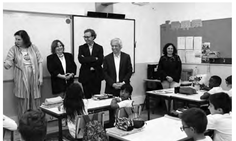
ESTABELECIMENTO DE ENSINO ACOLHE 59 ALUNOS