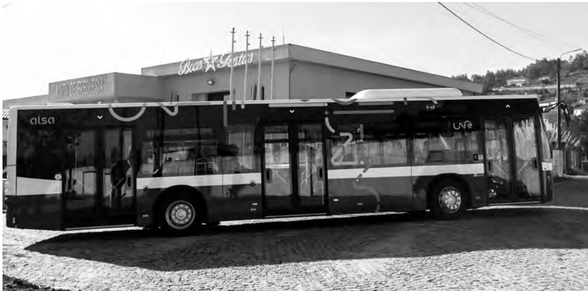
PCP QUER “AJUSTES E ACRESCENTOS À MOBILIDADE” E “CUMPRIMENTO DOS DIREITOS DOS MOTORISTAS”

Com o intuito de “avaliar o funcionamento da rede Unir”, o PCP esteve reunido com a Área Metropolitana do Porto (AMP), a quem exigiu esforços no sentido de proceder, rapidamente, a uma “fiscalização” aos serviços contratados, para, entre outras medidas, “garantir a publicação dos horários em toda a rede e o respeito pelo seu cumprimento”.