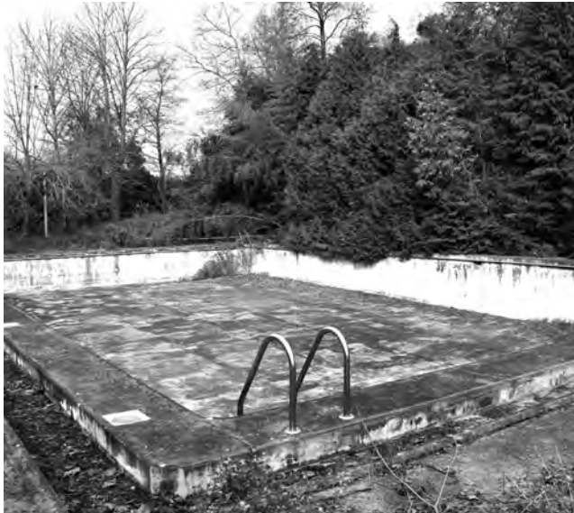
REQUALIFICAÇÃO IMPLICA INVESTIMENTO DE 150 MIL EUROS

O Parque de Lazer António Sampaio tem sido alvo de diversos investimentos para benefício da comunidade. Além da instalação do Campus da Proteção Civil, iniciada em 2022, a área também oferece outras valências recreativas e de lazer. A requalificação do campo de ténis e a instalação de um parque infantil são alguns dos