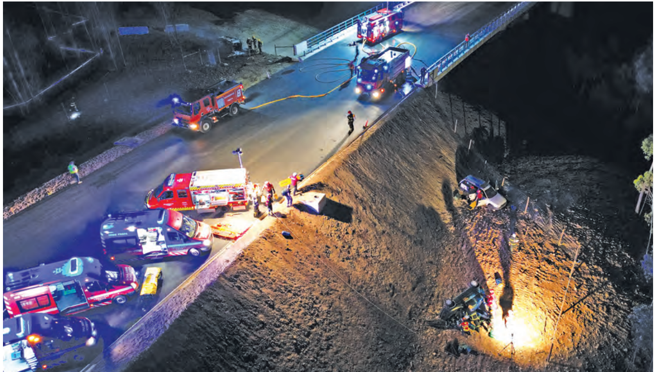
EXERCÍCIO ENVOLVEU DEZENAS DE MEIOS E OPERACIONAIS

“Com este exercício pretendíamos testar toda a nossa resposta operacional e a capacidade em termos de em-