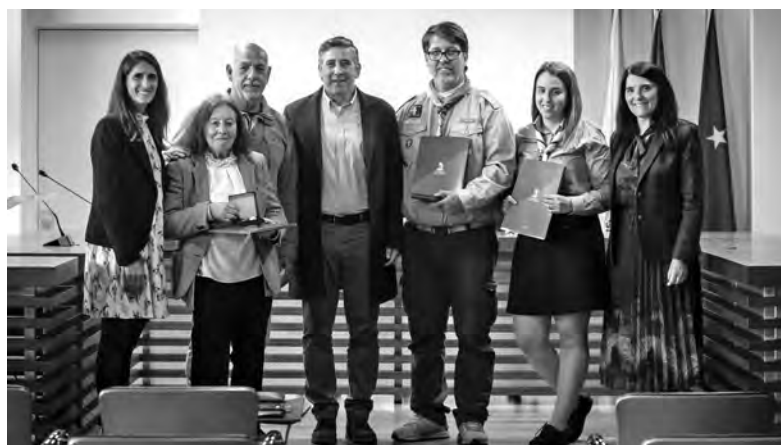
PROTOCOLO DE CEDÊNCIA ASSINADO A 2 DE MAIO

O protocolo, que tem a duração de um ano e é renovado – automaticamente – por períodos iguais, foi assinado a 2 de maio com a associação Amadores de