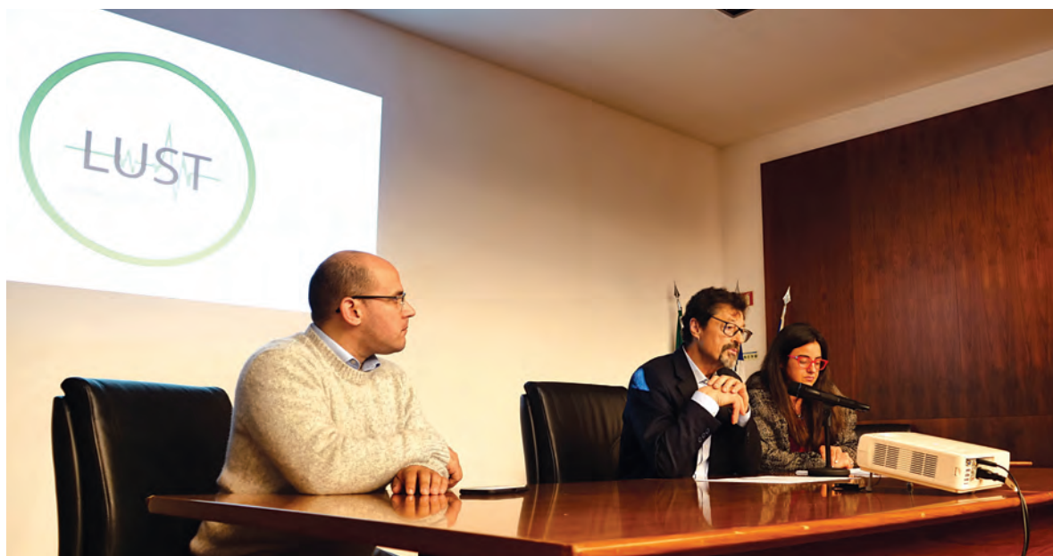
CRIAÇÃO DA ASSOCIAÇÃO SURTIU DA VONTADE DE FAZER OUVIR OS UTENTES JUNTO DAS ENTIDADES PÚBLICAS DE SAÚDE

“Entendemos que era este o momento, tendo em conta as transformações no Sistema Nacional de Saúde e os problemas verbalizados por muitos utentes, principalmente ao nível da unidade de cuidados especializados em S. Martinho, alvo de algumas queixas relacionadas com dificuldades em marcar consultas e alguma diferença de tratamento que sentiam em compara-