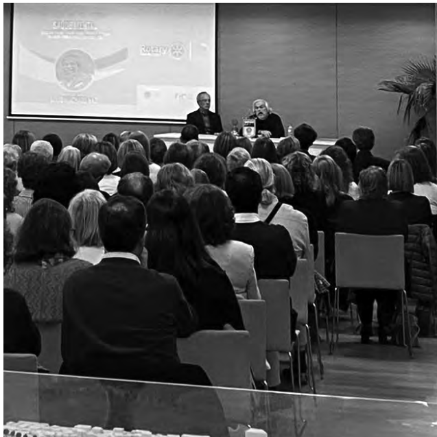
PALESTRA CONTOU COM PLATEIA MUITO INTERVENTIVA

De olhos voltados para o futuro, o Rotary Club da Trofa pretende dar continuidade a este ciclo de palestras, já para o próximo ano.